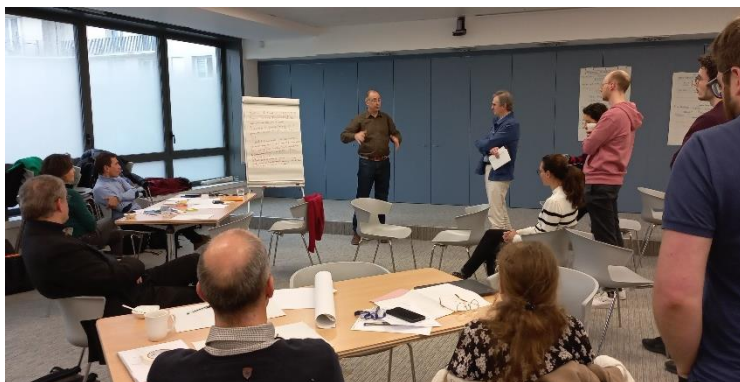
Premiers écrits durant le second atelier.