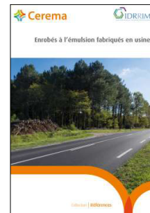
Enrobés à l'émulsion fabriqués en usine (Référence SKU2035284410 - Numéro ISBN 978-2-37180-456-2)