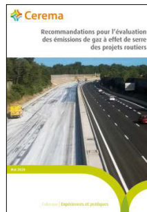
Recommandations pour l'évaluation des émissions de gaz à effet de serre des projets routiers - (Référence SKU2022294392 - Numéro ISBN 978-2-37180-453-1)