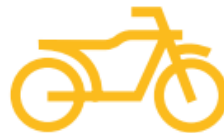
Les accidents de deux roues motorisés