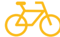
Les accidents de vélo