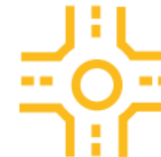
Les accidents en intersection