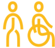
Les accidents piétons

Cette étude a permis d'identifier les quatre enjeux prioritaires pour le territoire métropolitain :