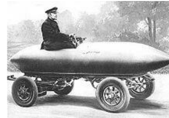
La Jamais-contente, 1899