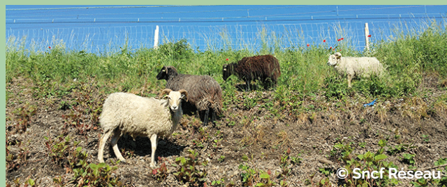
Moutons pâturant de la renouée aux abords d'une voie ferrée.