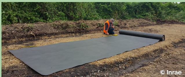
Pose d'un géotextile synthétique anti-renouée.