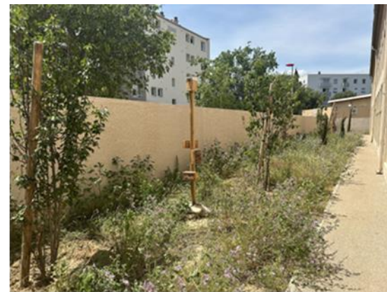
Ecole J Macé (mairie Narbonne)