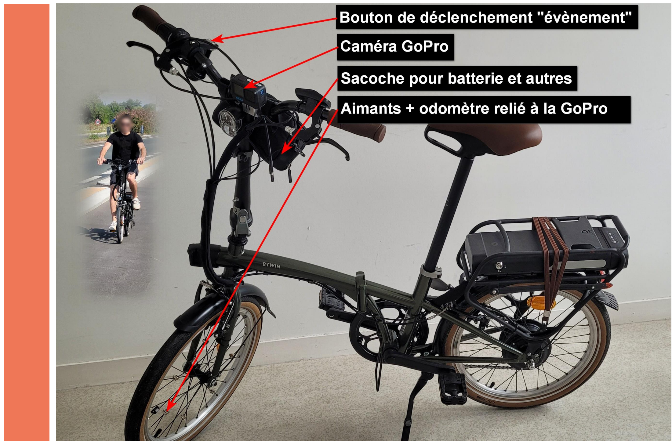
DIAGVELO est adaptable à tout type de vélo (sans suspension avant).

La GoPro fixée sur le guidon enregistre, en plus du film, les imperfections de l'uni, les pentes. Les différents calibrages, réalisés en usine, diminuent de façon conséquente les incertitudes des mesures.