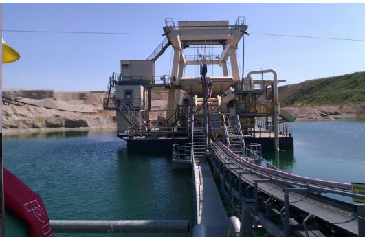
Dragage des matériaux