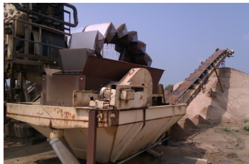
Traitement de sable