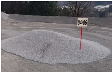
Stock de granulats