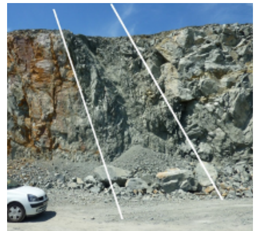
Zone broyée et altérée (présence de faille)