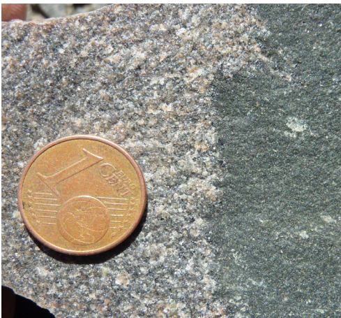
Identification des faciès : contact granite/diorites