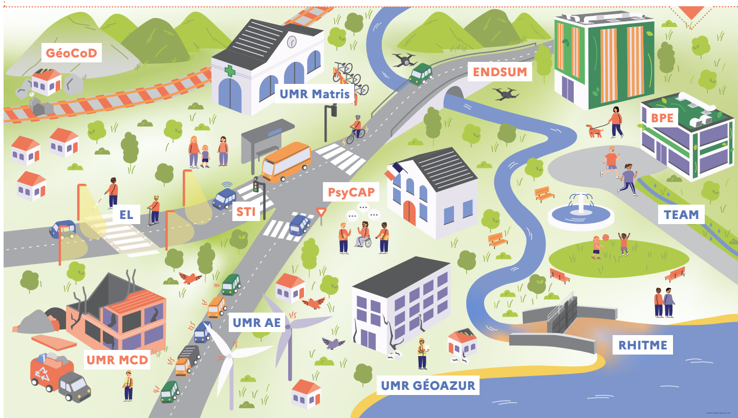
Illustration : Agence 4 Août — crédits photos : ©Cerema — Ne pas jeter sur la voie publique

Bâtiments Performants dans leur Environnement