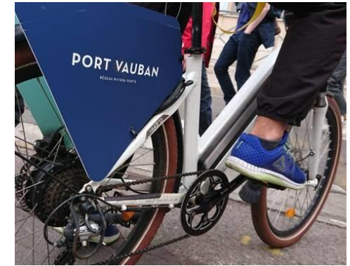
Innovations, usages et services