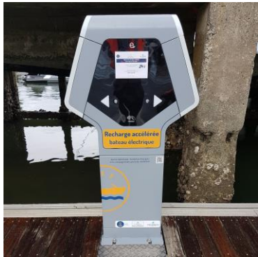
Verdissement de la flotte