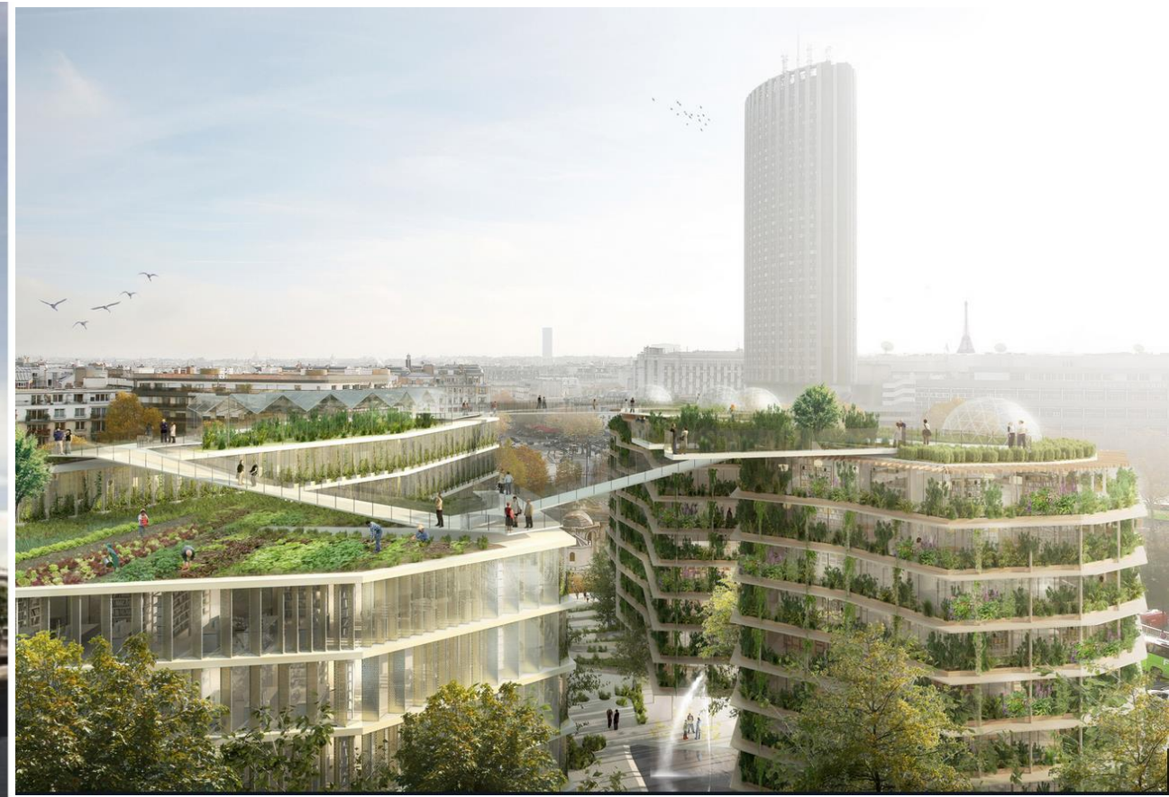
Projet Ville multi-strates