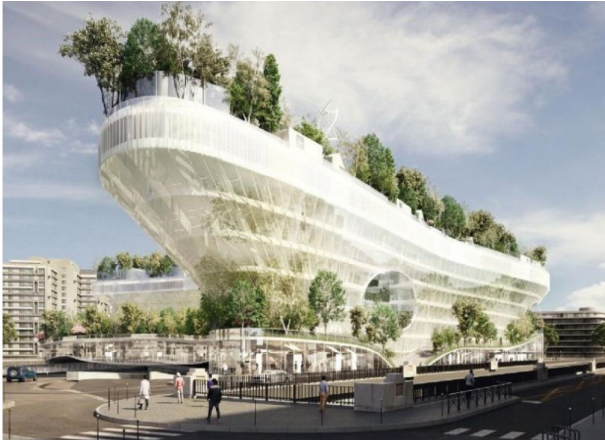
Projet Ville des mille arbres