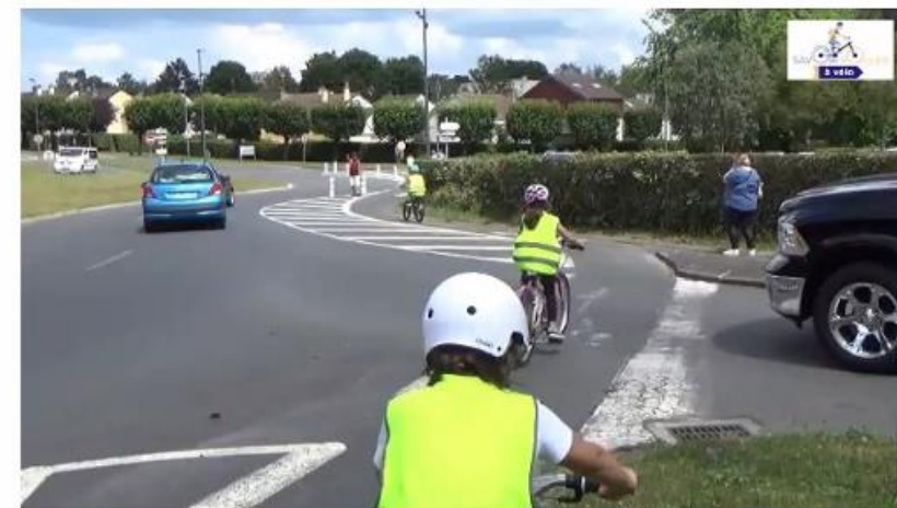
Bloc 3 en situation réelle