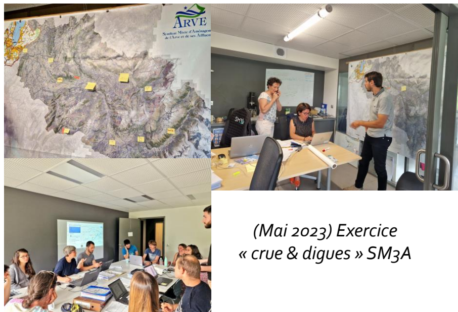
(Mai 2023) Exercice « crue & digues » SM3A