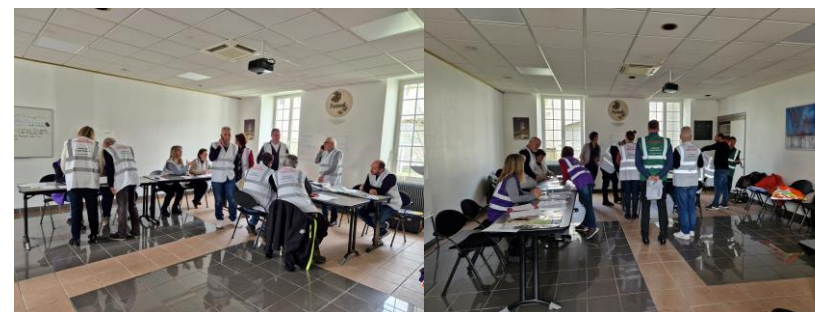
(Mars 2023) Entraînement sur table Fontanil-Cornillon (Grenoble Alpes Métropole)