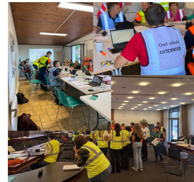
(Oct. 2023) Exercice intercommunal Gières | Saint-Martin-d'Hères | Grenoble Alpes Métropole