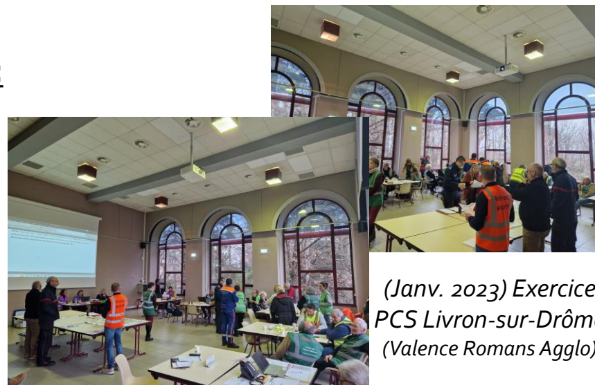
(Janv. 2023) Exercice PCS Livron-sur-Drôme (Valence Romans Agglo)