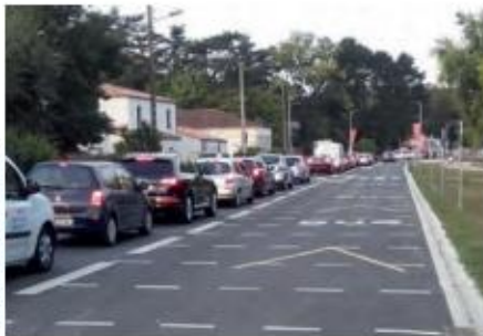
Basse-Goulaine (44) : partage temporel stationnement – voie bus