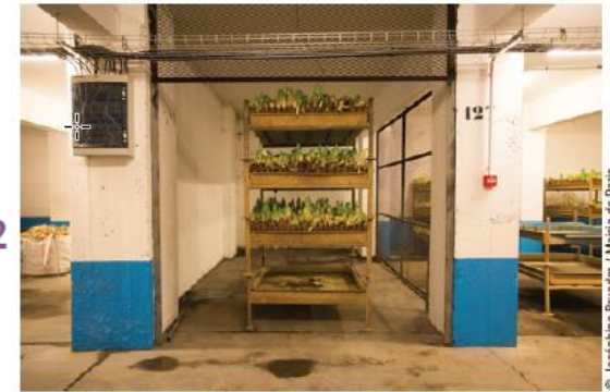
Forçage des endives, sur planches de culture

2 000 m 2 moyenne des surfaces cultivées à Paris dans les parkings souterrains