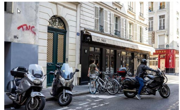
En un an, 44 800 droits de stationnement résidentiel pour deux-roues ont été accordés par les services de la Ville de Paris.

Depuis le 1er septembre 2022, les conducteurs de scooters et de motos doivent s'acquitter d'un tarif équivalent à la moitié de celui des voitures pour occuper l'une des 42 000 places qui leur sont dédiées.