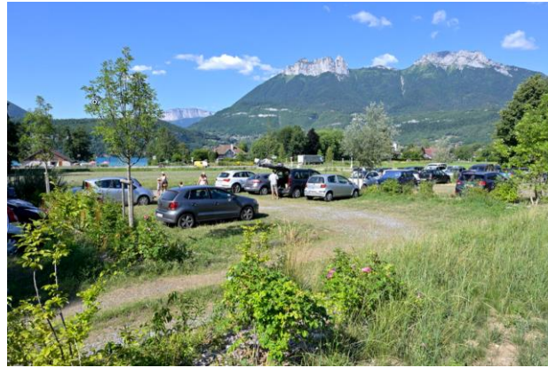
Duingt (74) : parking végétalisé