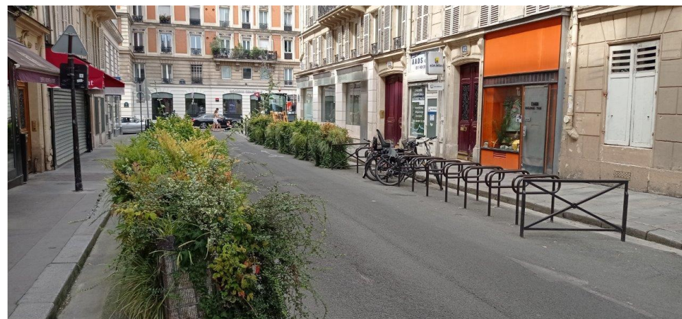
Rue de Bruxelles, Paris