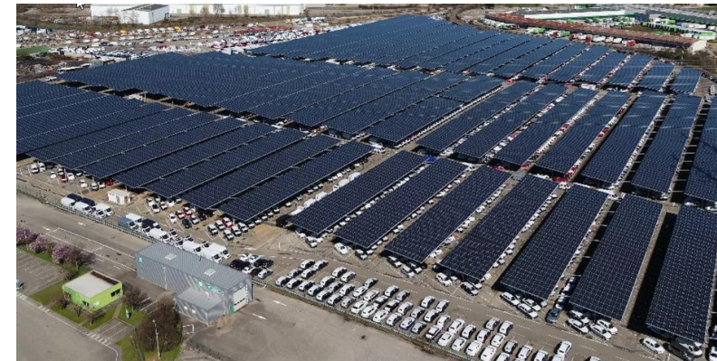
Ombrières photovoltaïques sur un parking de la ZI de Corbas (69)