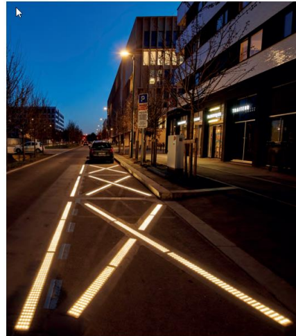
Saclay (91) : partage temporel livraisons – stationnement de courte durée