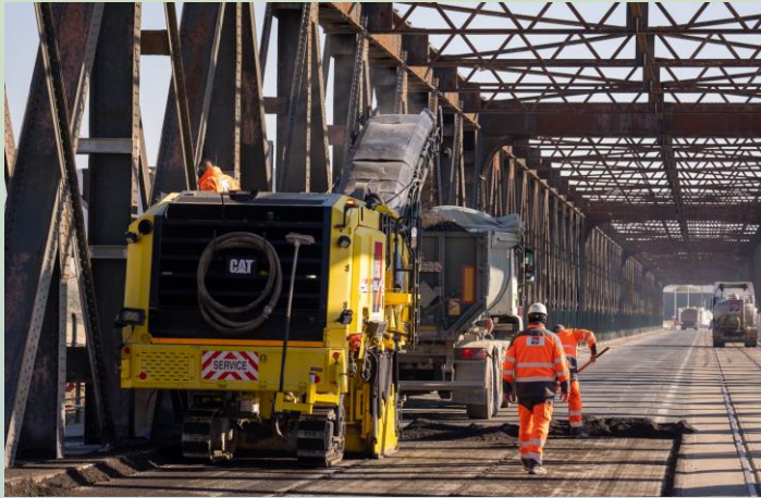
Rabotage des enrobés