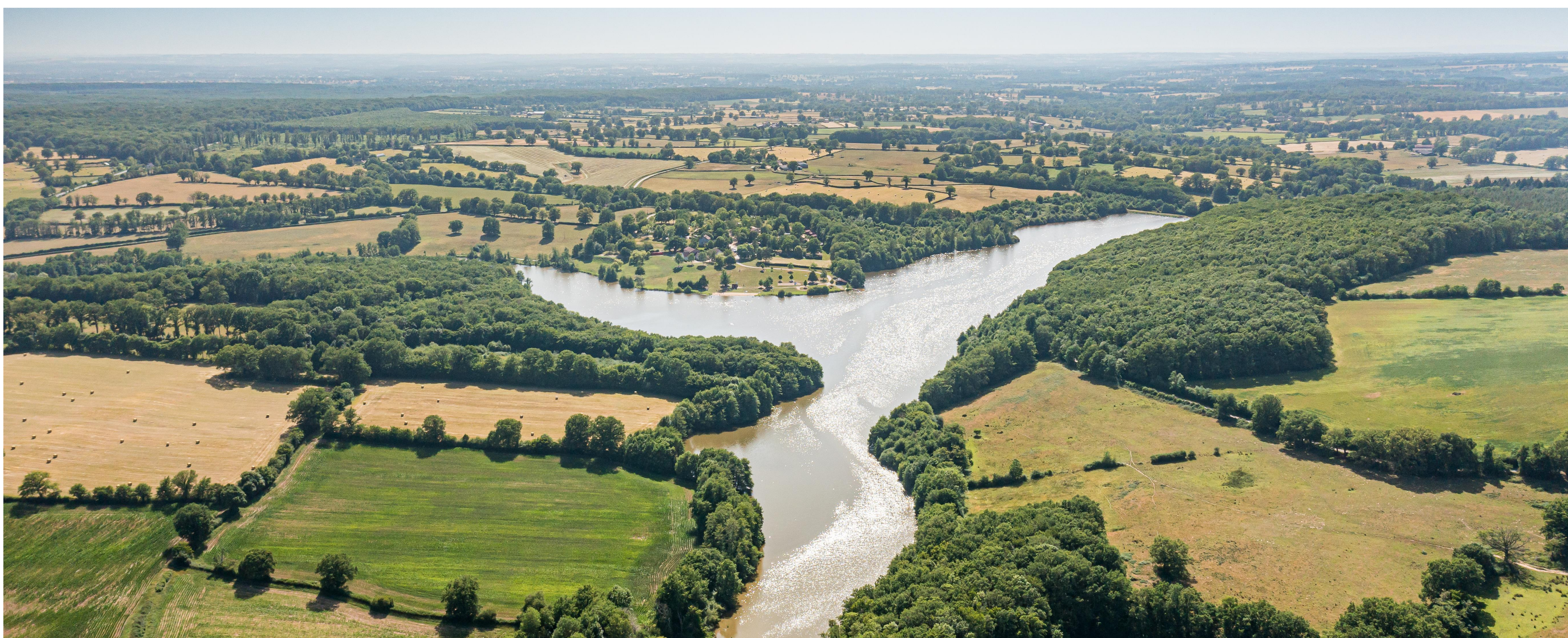
Vue aérienne du Bocage bourbonnais