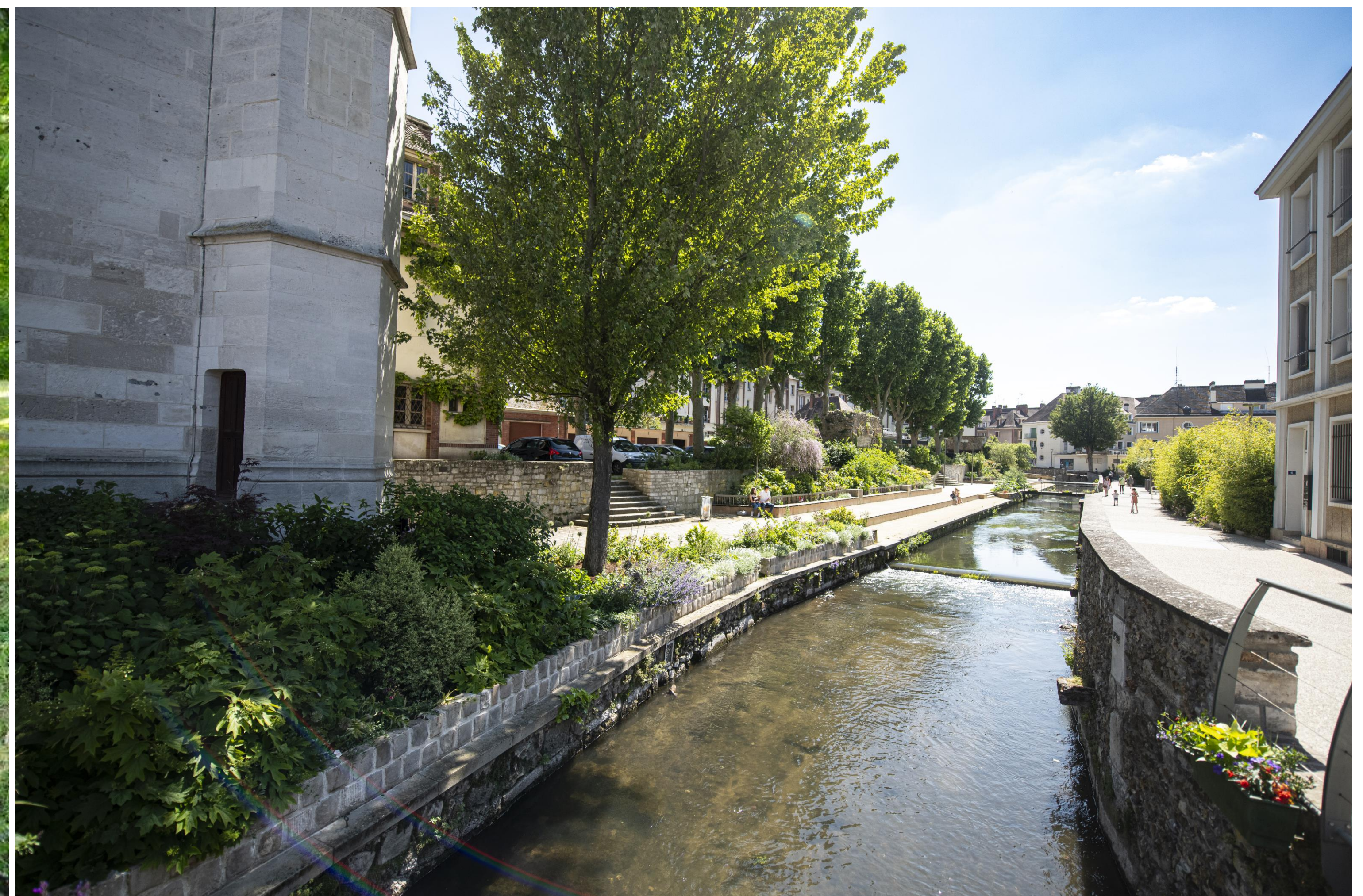
Iton, Évreux