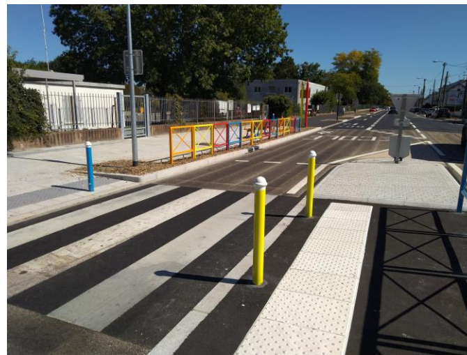
Ecole La Chauvinière - Nantes

À proximité d'un boulevard : mise en place d'un îlot piéton large avec une signalétique renforcée, et une sécurisation des traversées piétonnes →