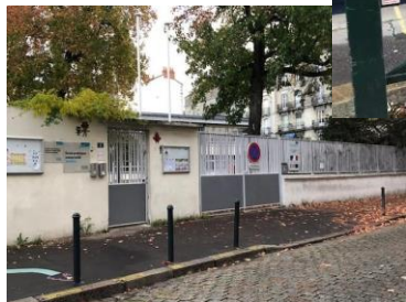
Ecole Molière - Nantes