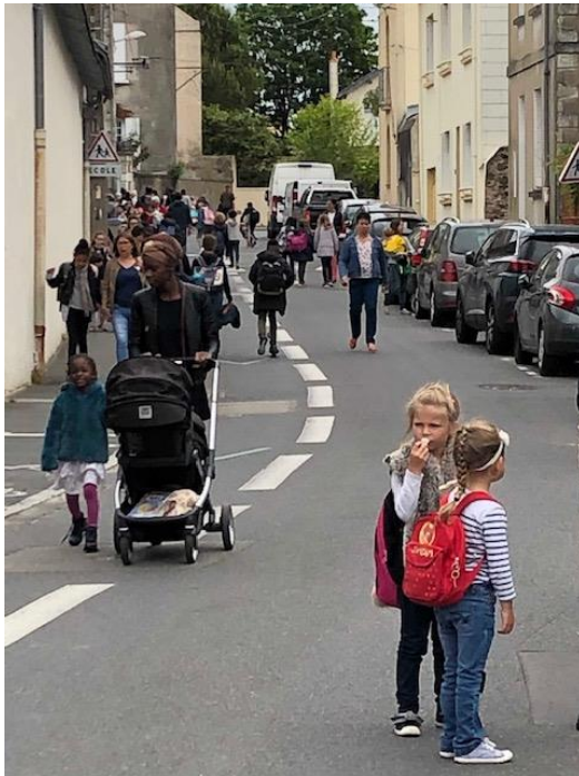
Ledru Rollin - Nantes

Un dispositif parmi d'autres pour apaiser les abords des écoles