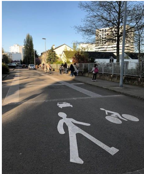
Ecole Anatole de Monzi - Nantes