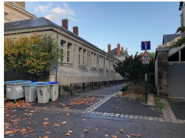
Ecole Stalingrad - Nantes

Passage d'une voie sans issue en voie piétonne permanente →