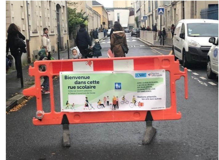
Ecole Emile Péhant – Nantes Expérimentation depuis le 7/11/22