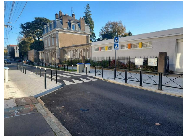
Ecole Rue Noire - Nantes