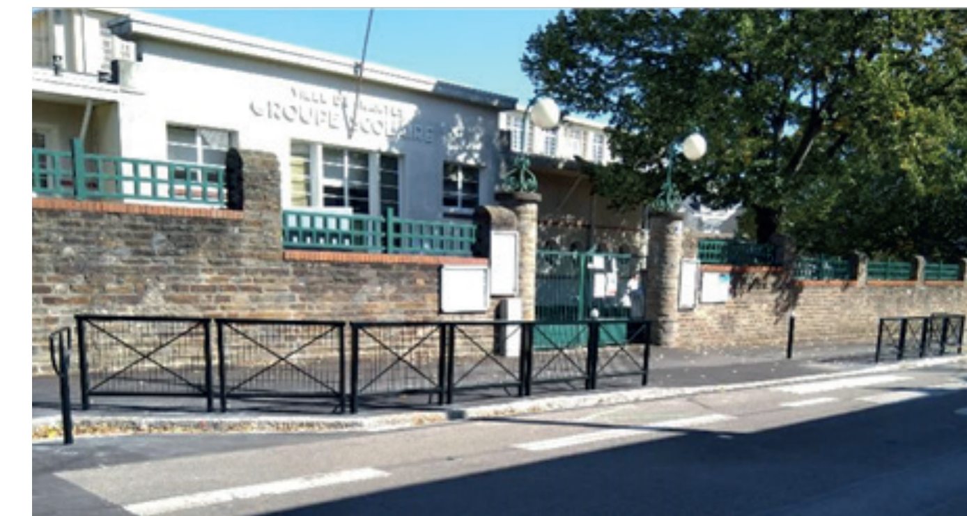
École Longchamp, Nantes