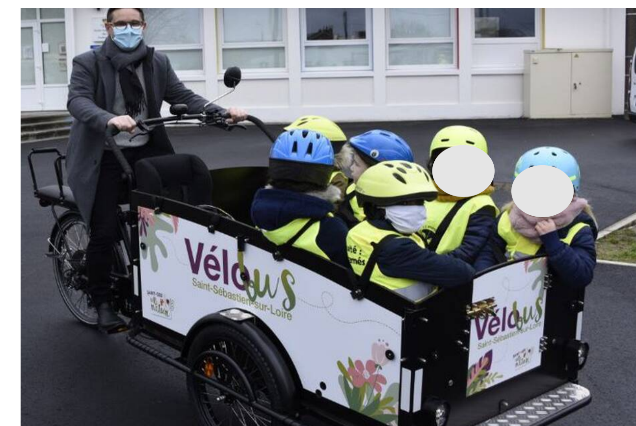
Saint Sébastien sur Loire