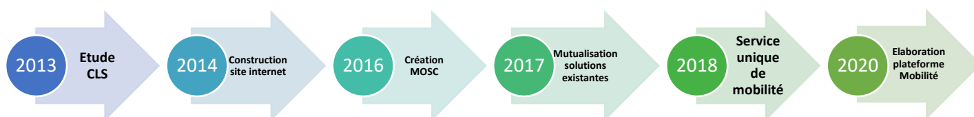
Figure 3 : Les étapes du projet MOSC

Le Conseil Départemental de la Charente a ensuite choisi d'accompagner et d'aider le projet MOSC. Il contribue à la co-construction de la démarche et a invité le territoire Ouest Charente à s'associer au territoire Sud Charente.