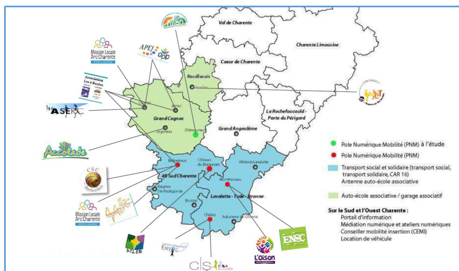
Figure 1: MOSC : Un projet qui couvre le territoire de 4 structures intercommunales

Le territoire d'intervention de MOSC s'est élargi en s'étendant jusqu'à la communauté d'agglomération de Cognac (69 000 habitants) et la communauté des communes du Rouillacais (10 000 habitants), mais avec des services proposés moins complets.