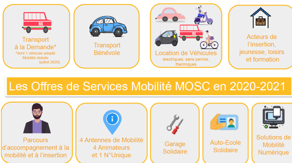
Figure 5: Les services proposés par MOSC

Tous ces services de mobilités sont proposés au travers de dispositifs mutualisés, qui permettent d'aiguiller l'utilisateur vers le service le plus adapté :