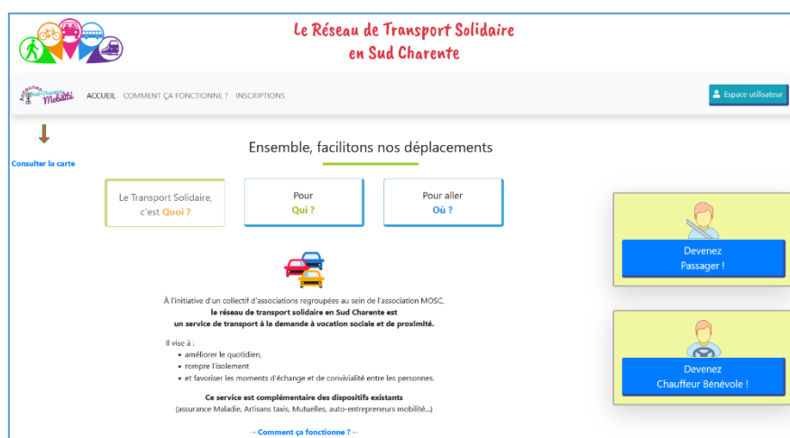
Figure 4 : La plateforme de transport solidaire de MOSC

En complément, une plateforme de mobilité solidaire a été initiée en 2021. Après une campagne de communication à l'automne, la plateforme propose une carte interactive des offres et demandes en temps réel, proposant ainsi un outil mutualisé entre les différents services de transport solidaire. Les 4 animateurs mobilité permettent ensuite de faire fonctionner le dispositif.