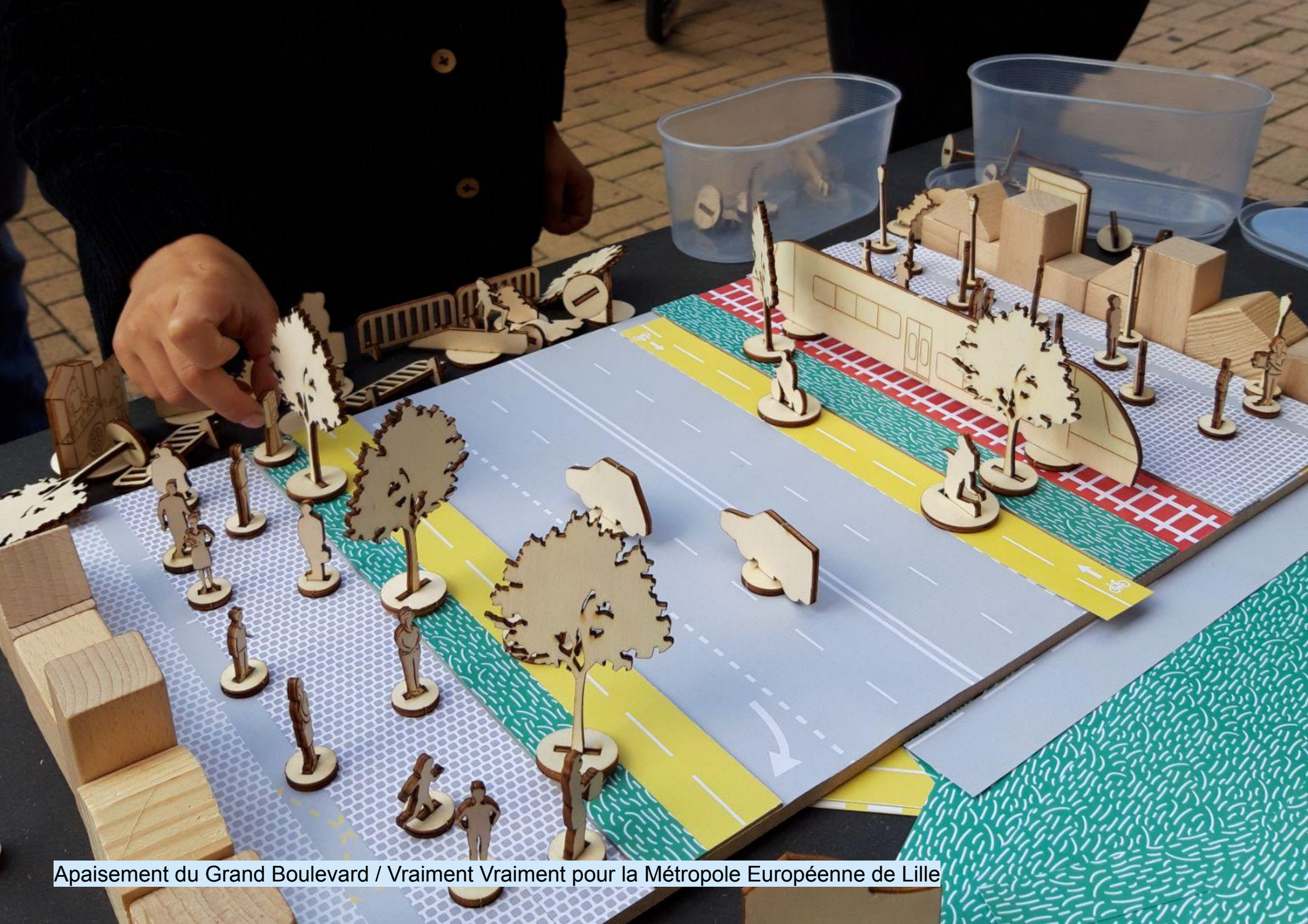
Apaisement du Grand Boulevard / Vraiment Vraiment pour la Métropole Européenne de Lille