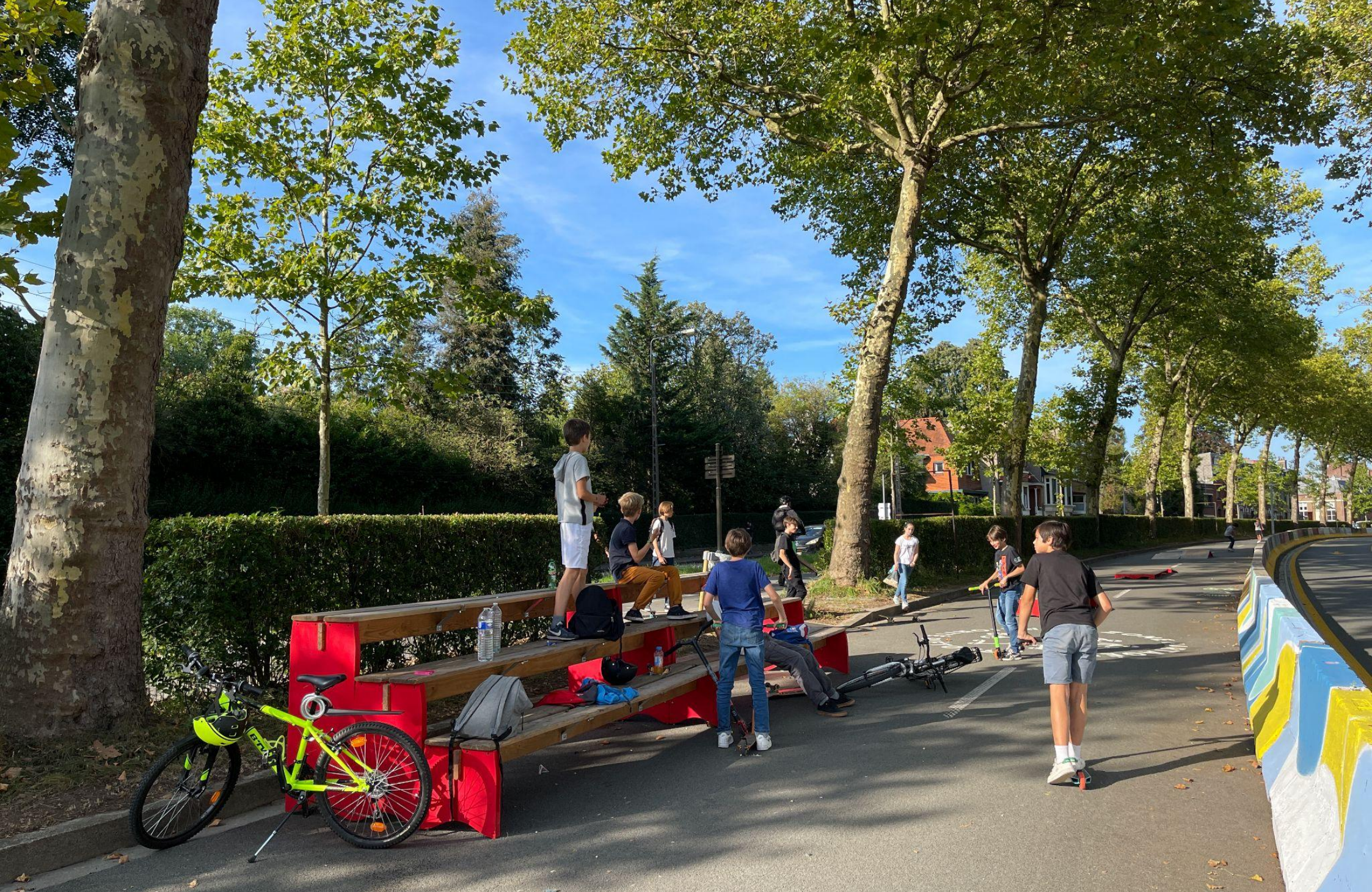
Apaisement du Grand Boulevard sur un kilomètre / Vraiment Vraiment pour la Métropole Européenne de Lille