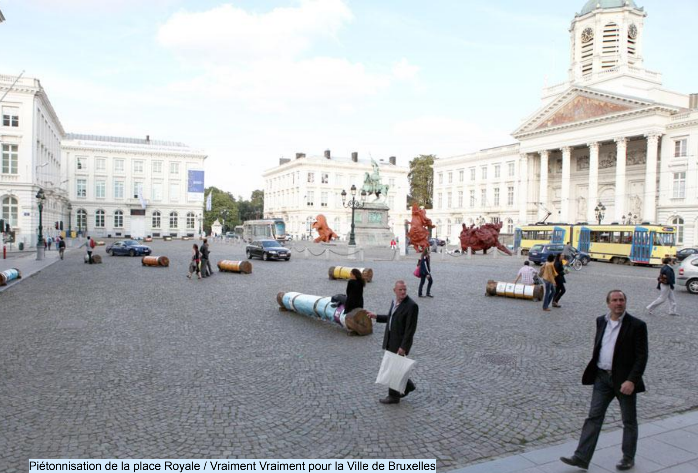
Piétonnisation de la place Royale / Vraiment Vraiment pour la Ville de Bruxelles