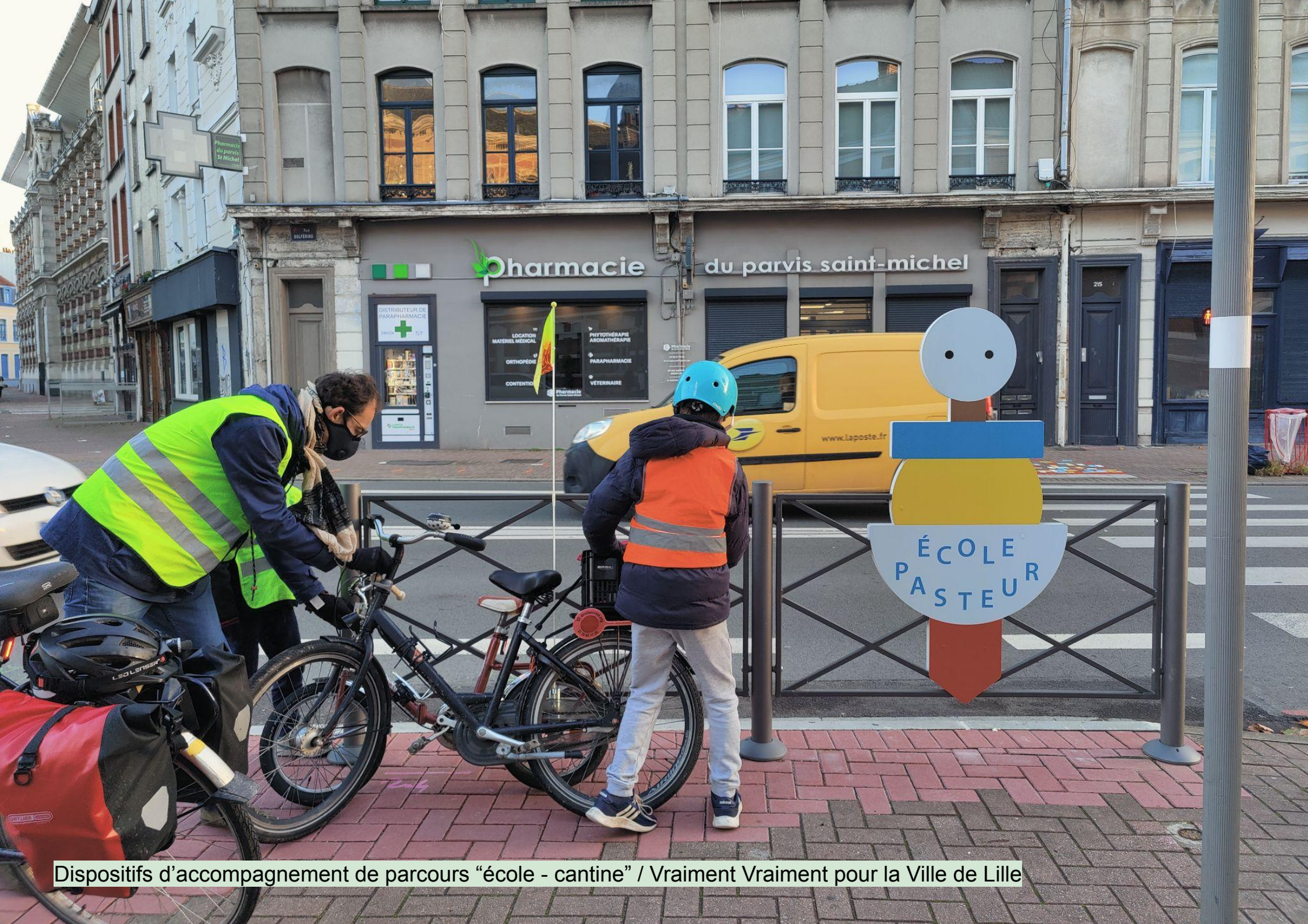
Dispositifs d'accompagnement de parcours "école - cantine" / Vraiment Vraiment pour la Ville de Lille