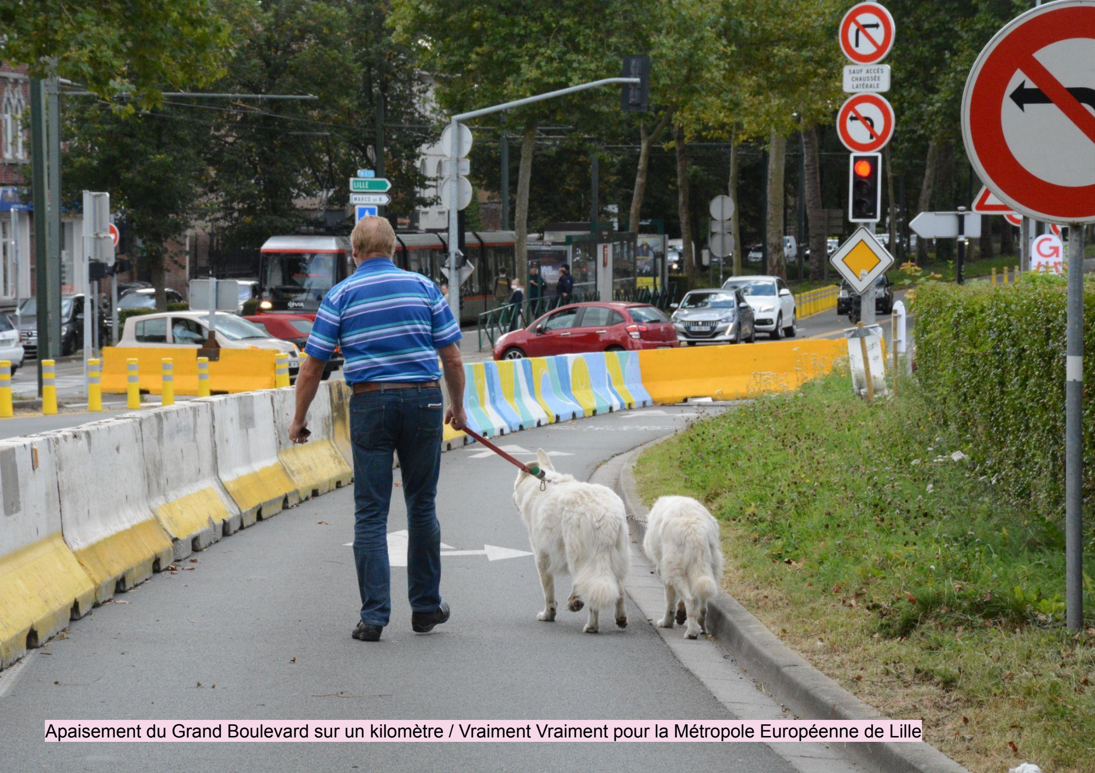
Apaisement du Grand Boulevard sur un kilomètre / Vraiment Vraiment pour la Métropole Européenne de Lille