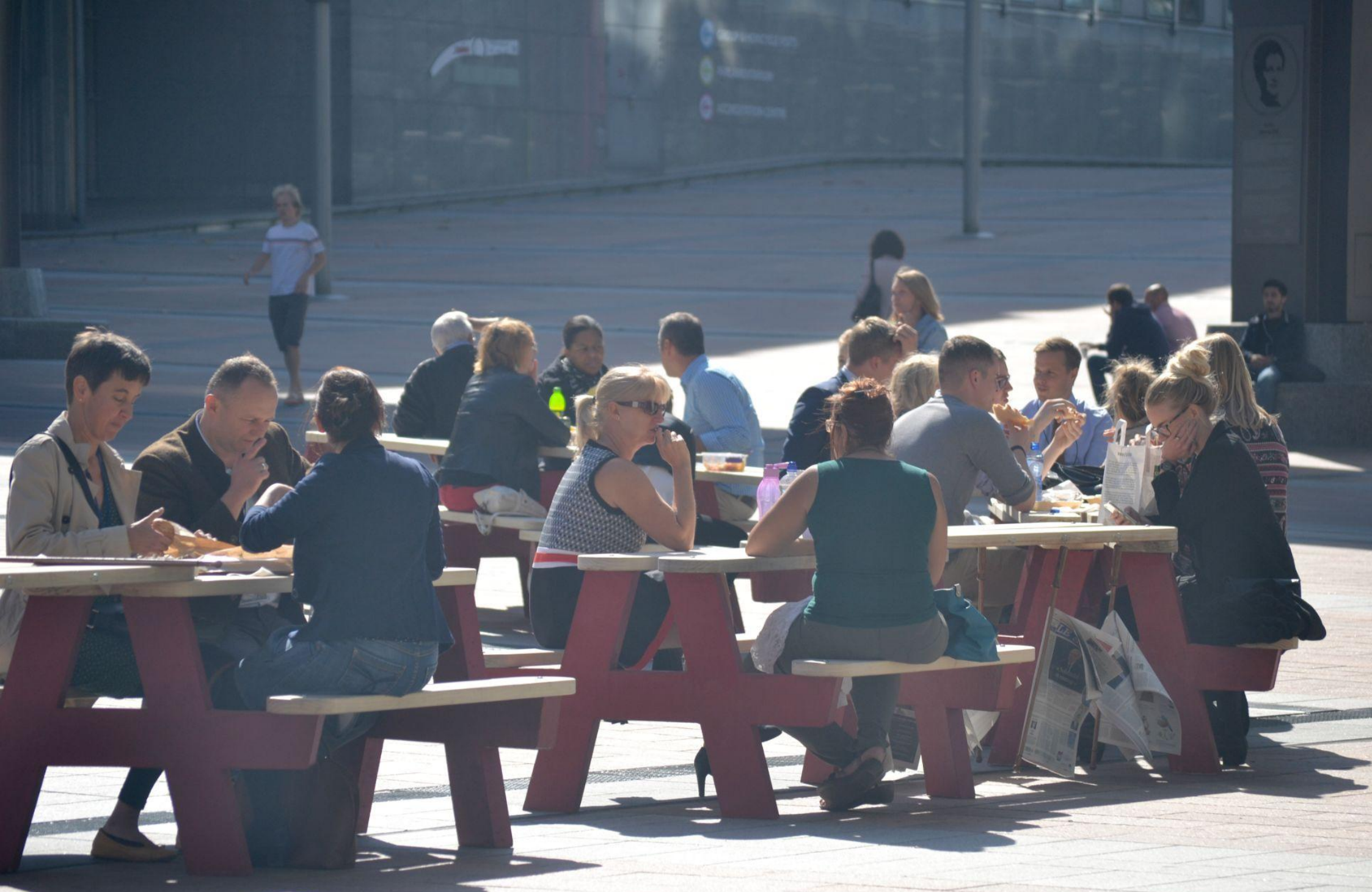
European Canteen / Vraiment Vraiment pour la Ville de Bruxelles