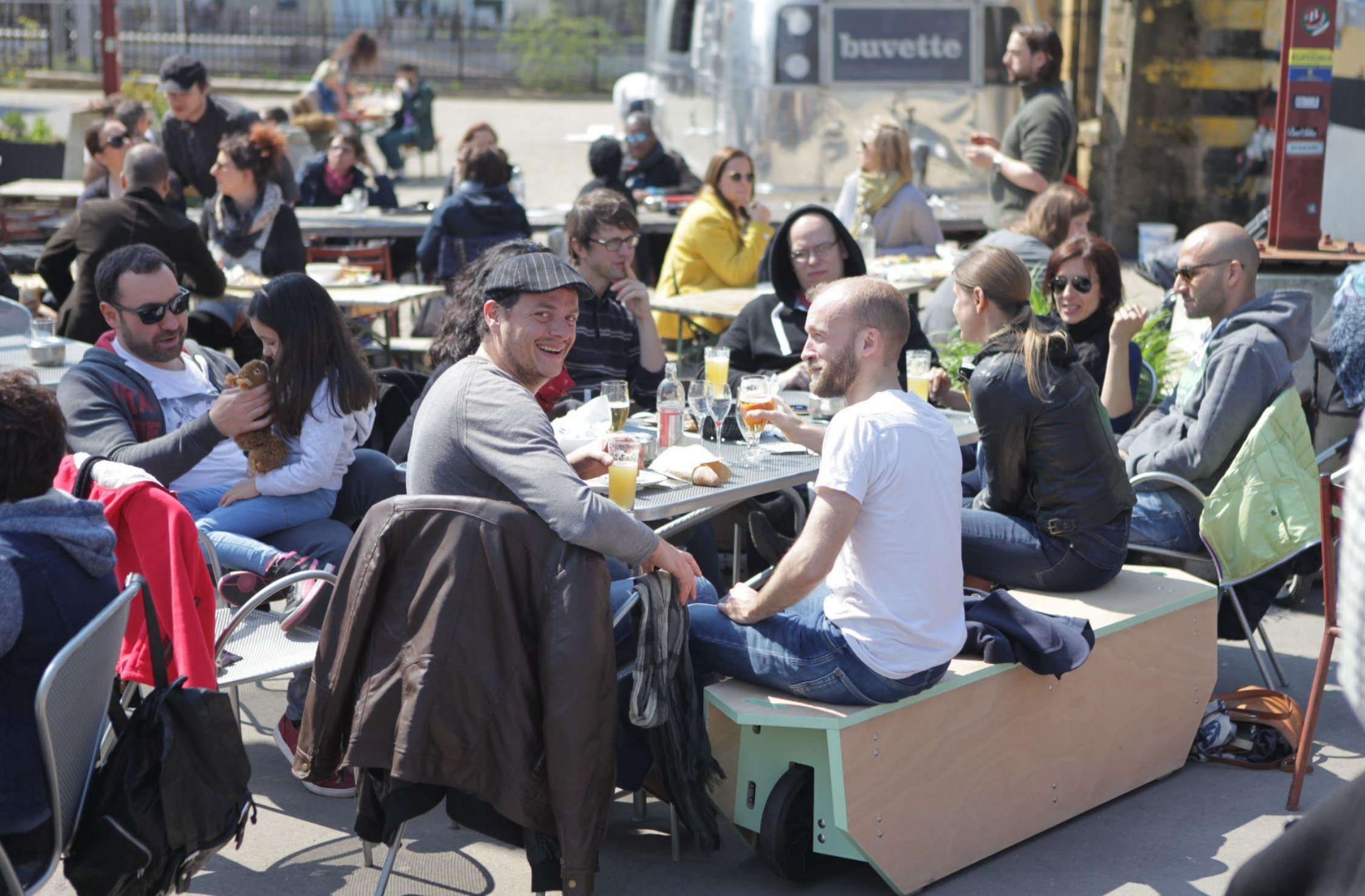
Mobilier modulable / Vraiment Vraiment pour le centre culturel des Rotondes, Luxembourg