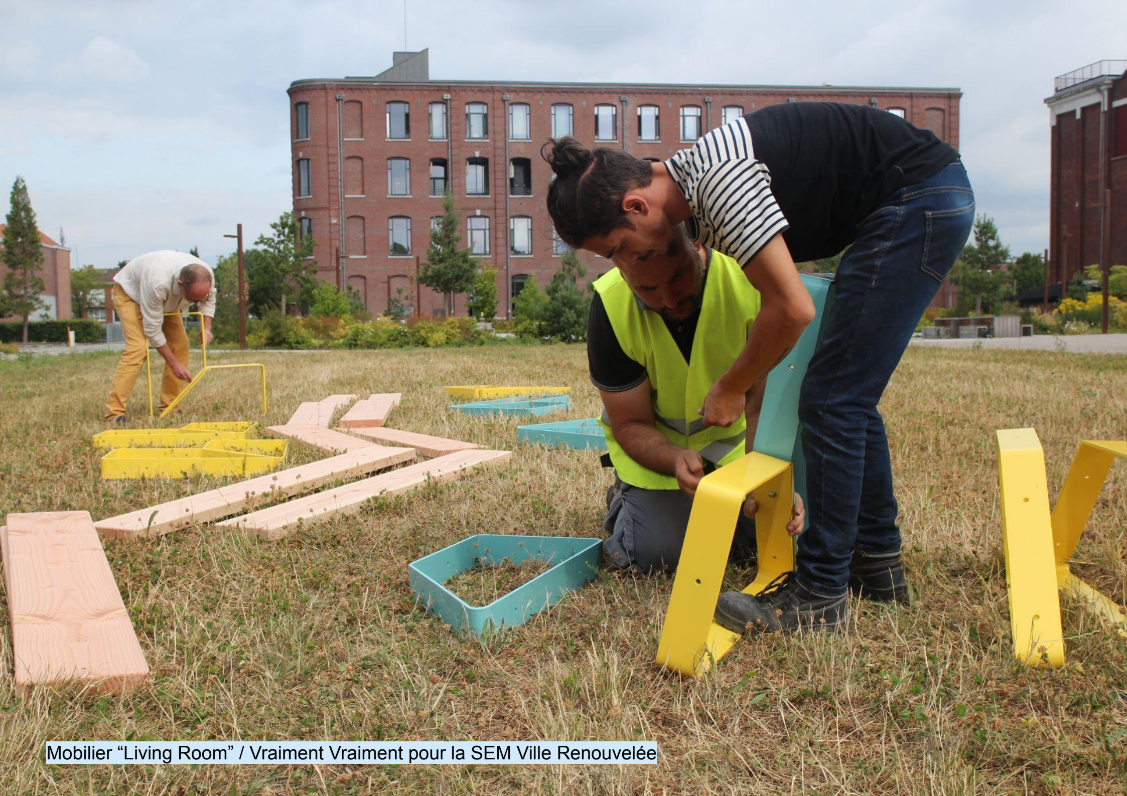
Mobilier "Living Room" / Vraiment Vraiment pour la SEM Ville Renouvelée