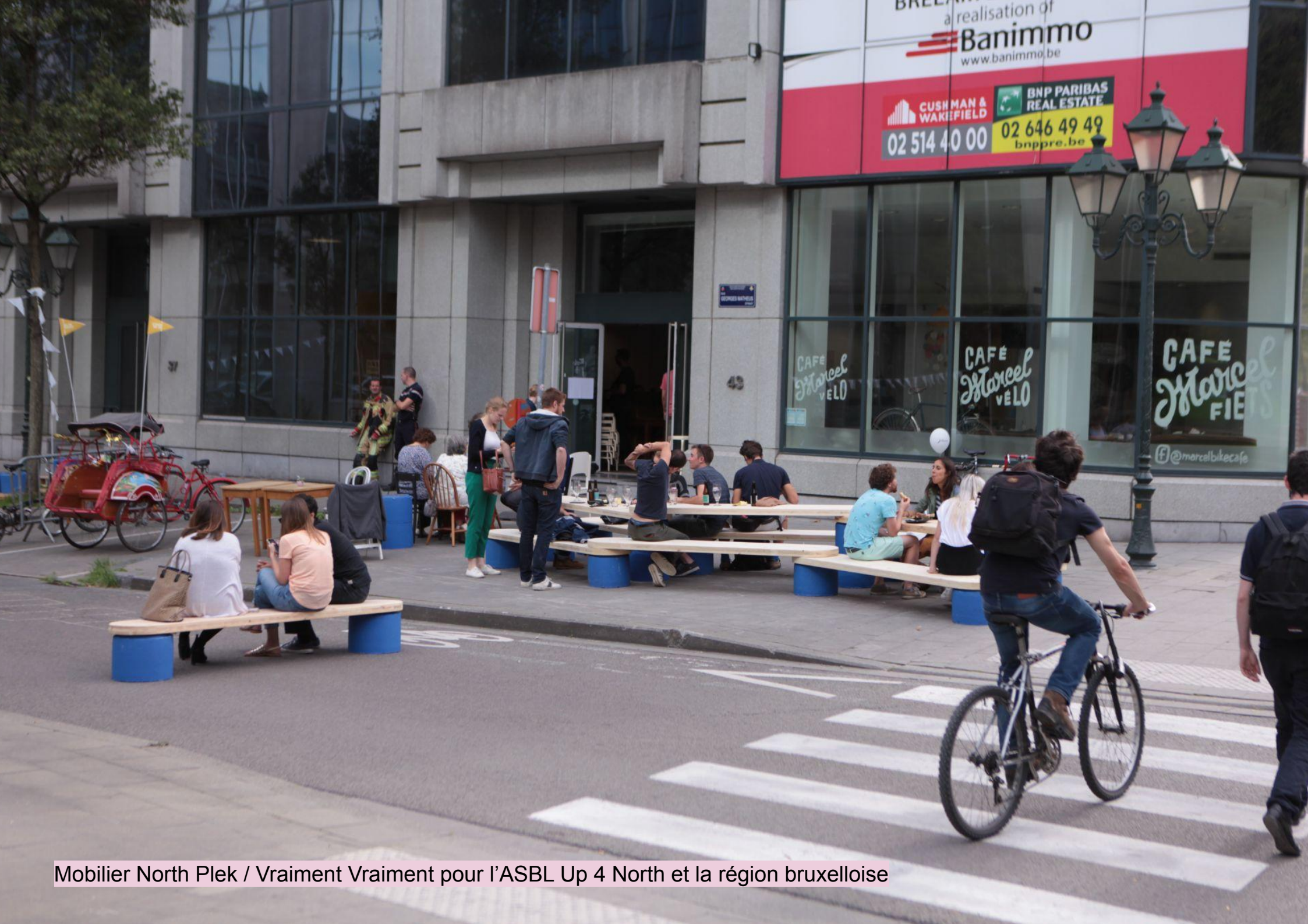
Mobilier North Plek / Vraiment Vraiment pour l'ASBL Up 4 North et la région bruxelloise