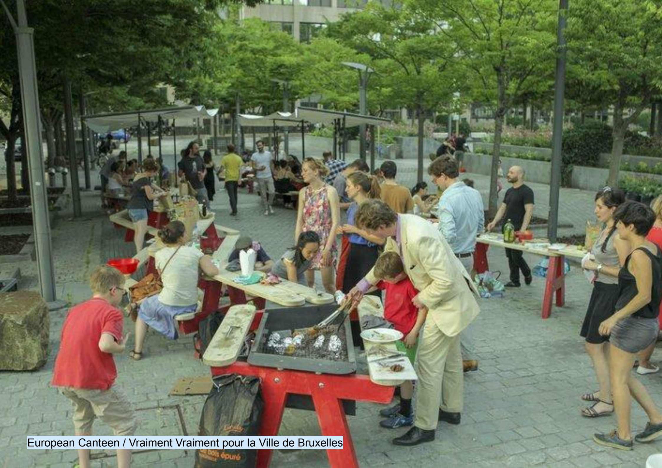
European Canteen / Vraiment Vraiment pour la Ville de Bruxelles