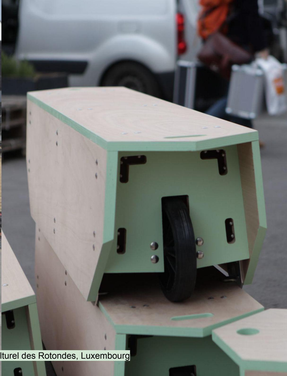
Mobilier modulaire / Vraiment Vraiment pour le centre culturel des Rotondes, Luxembourg