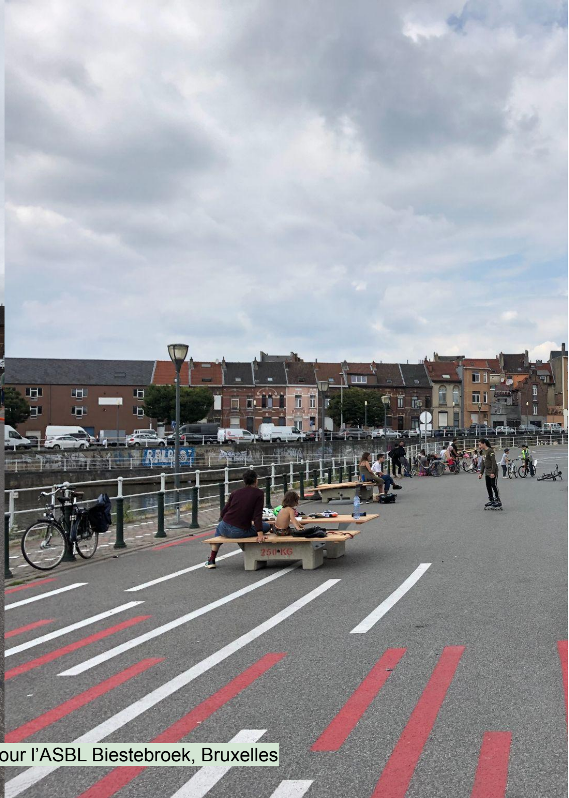
Mobilier extérieur du Hangar du Kanaal / Vraiment Vraiment pour l'ASBL Biestebroek, Bruxelles