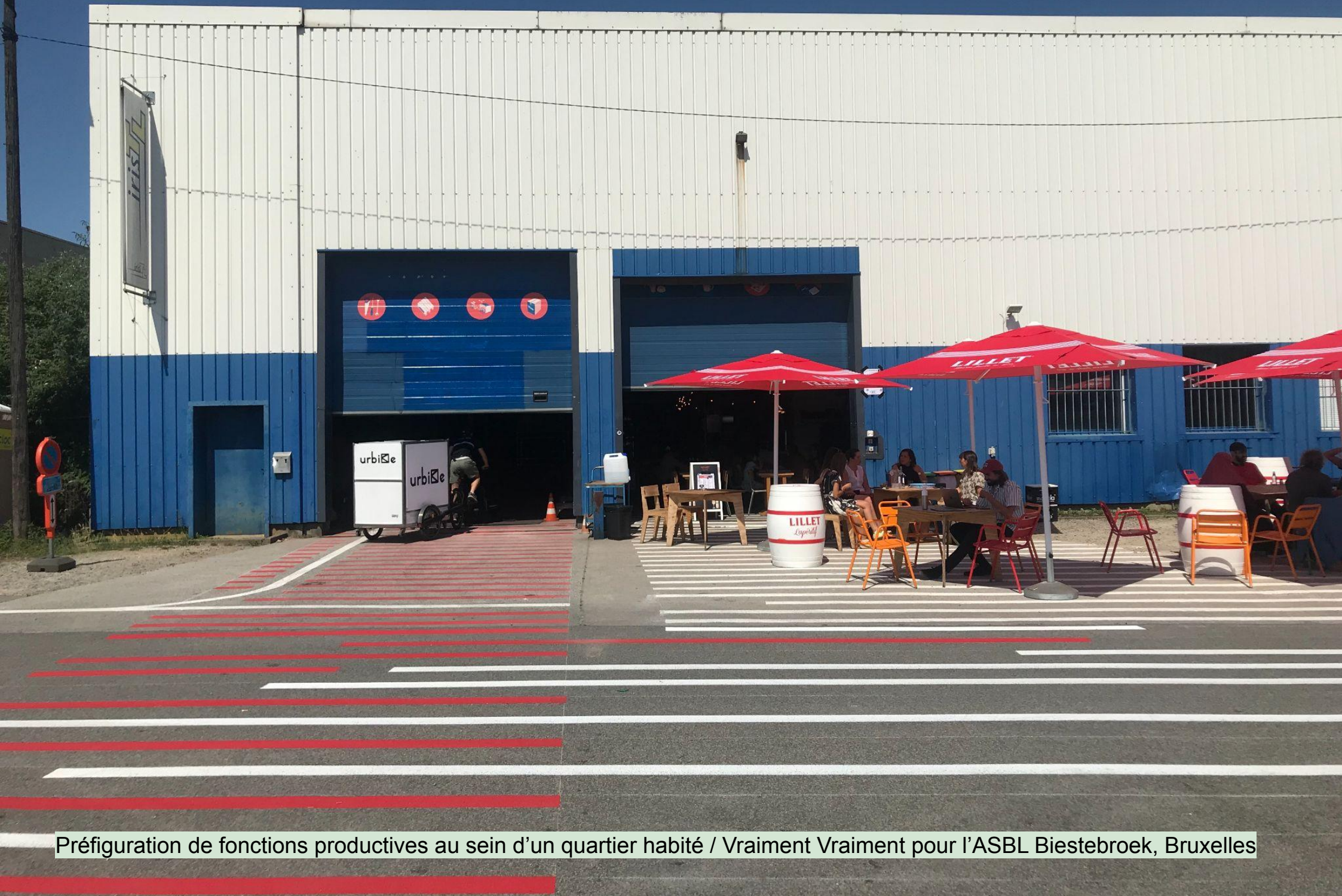
Préfiguration de fonctions productives au sein d'un quartier habité / Vraiment Vraiment pour l'ASBL Biestebroek, Bruxelles