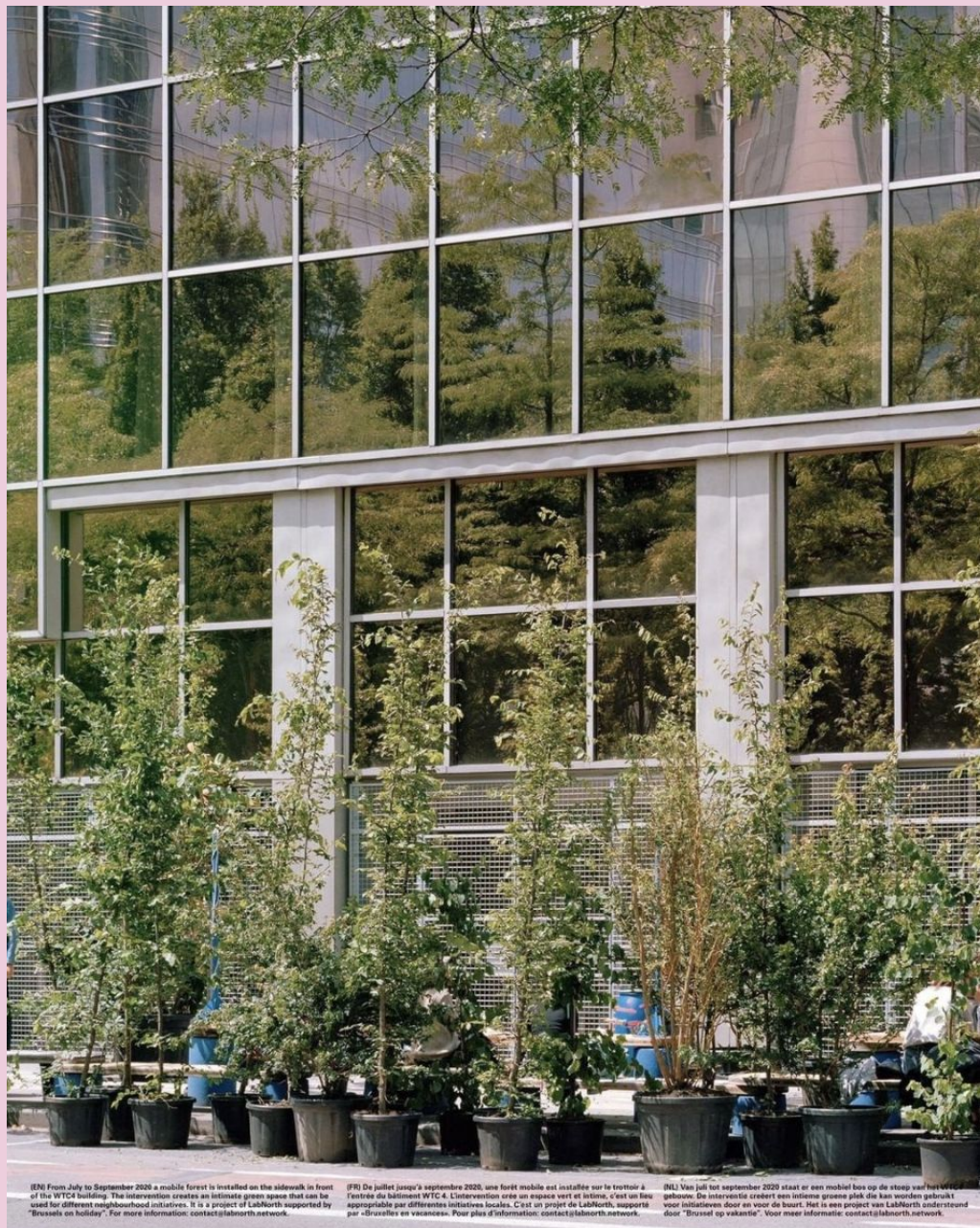
Le "kit forêt mobile" devant Stam Europa, Bruxelles / Vraiment Vraiment x Plant en Houtgoed