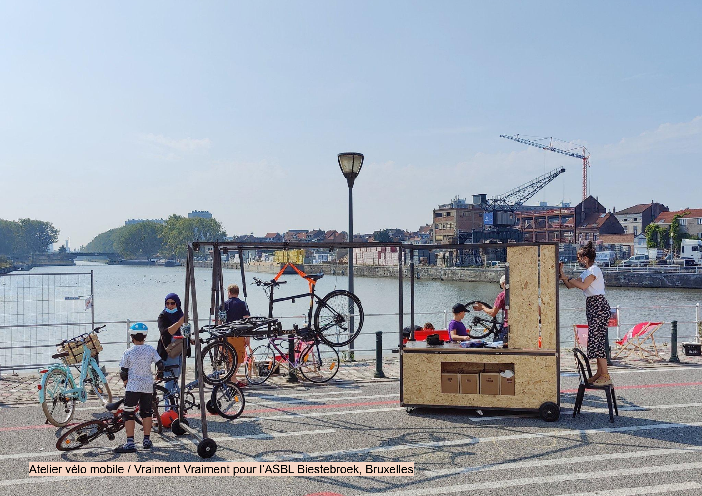
Atelier vélo mobile / Vraiment Vraiment pour l'ASBL Biestebroek, Bruxelles