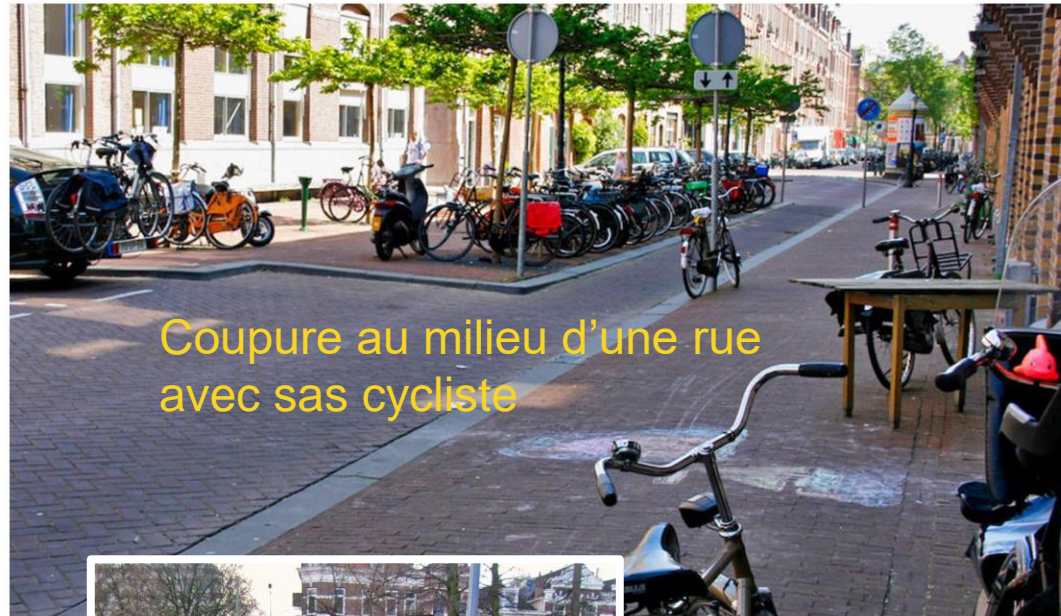
Coupure au milieu d'une rue avec sas cycliste