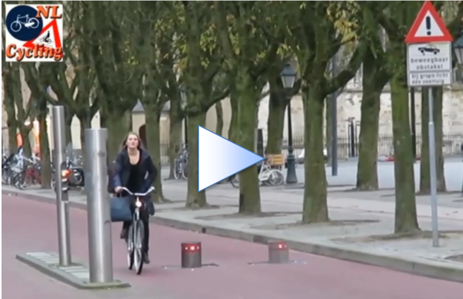
ILLUSTRATION EN VIDÉO