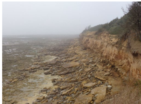
Falaises de roches tendres