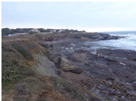
Falaises de roches dures

Du Nord-ouest au Sud-est, on peut distinguer les faciès littoraux suivants