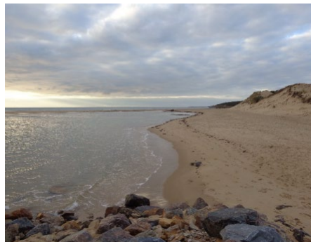
Côte à dominante sableuse avec la dune et la flèche sableuses du Veillon