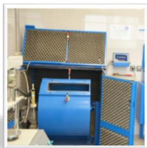
Illustration 1 : Los Angeles NF EN 1097-2

Dans le cadre de cette analyse des propriétés physiques et mécaniques à mener, le Cerema mettra en place une série de tests pour évaluer la conformité des boues à la norme « Granulat » NF EN 13242 + A1 , ainsi qu'aux normes NF P 11-300 pour les couches de formes et NF EN 13242 en référence pour les couches d'assises de chaussée.