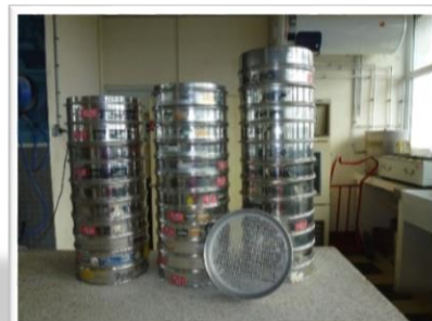
Illustration 3 : Granulométrie NF EN 933-1