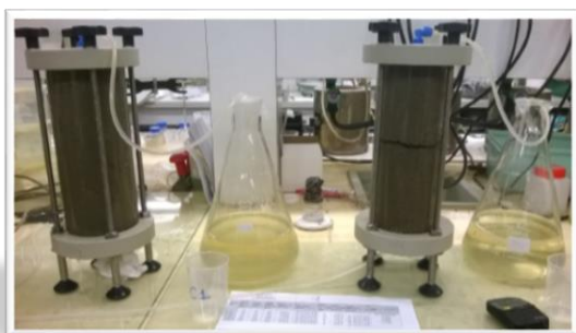
Illustration 5 : Colonnes de percolation