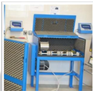
Illustration 2 : Micro Deval NF EN 1097-1