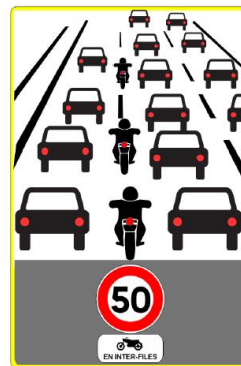
Panneau de type SR