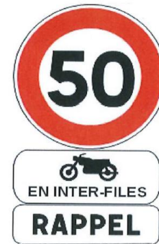
Panneau B14 avec panoneaux