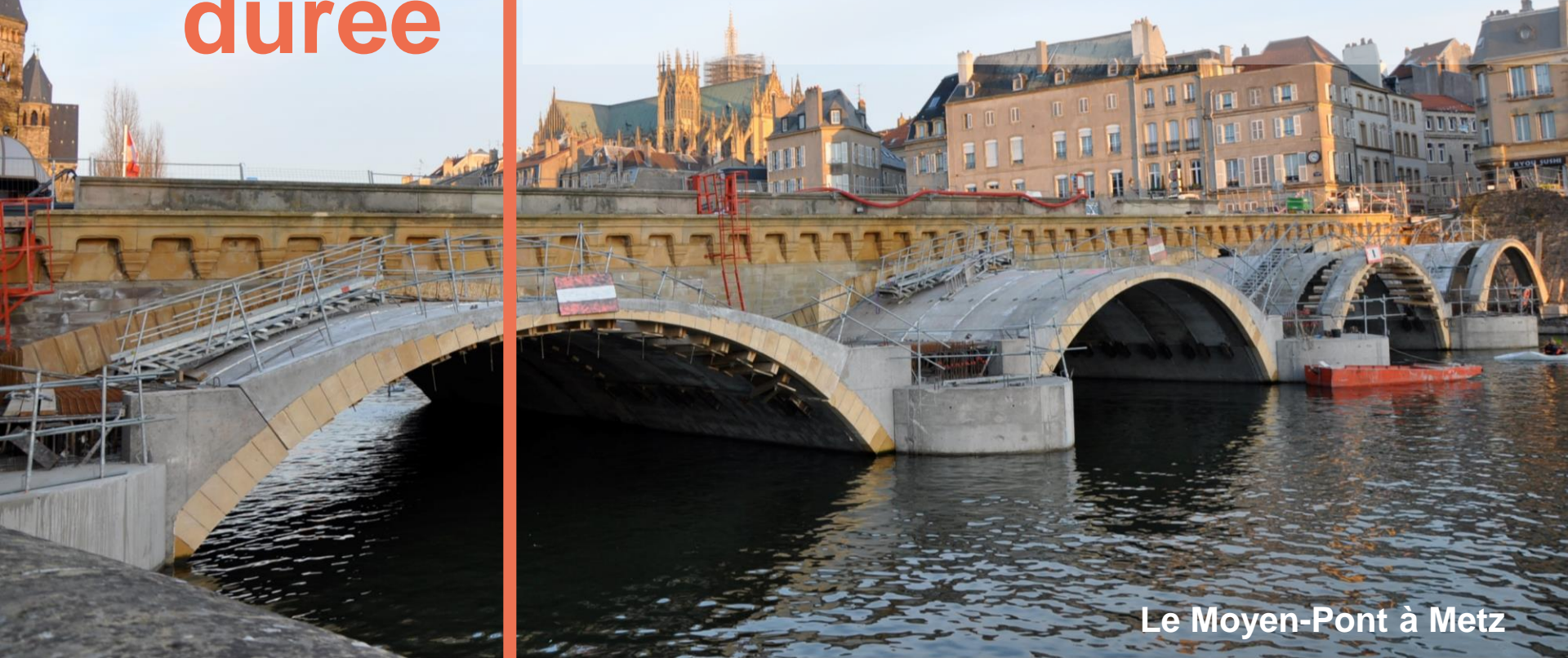
Le Moyon-Pont à Metz

Parole de groupe Biennale des territoires mars 2019