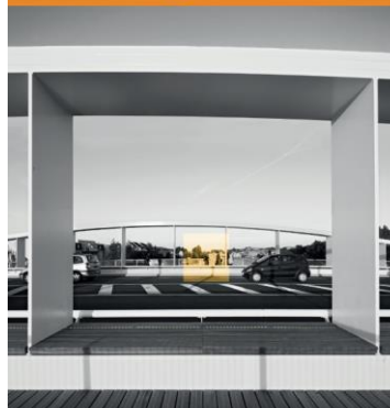
Une méthode d'évaluation de la qualité d'usage ?

Quelle qualité de services rendent-ils aux territoires ? aux métropoles, aux cœurs de ville, comme aux centres-bourgs ?