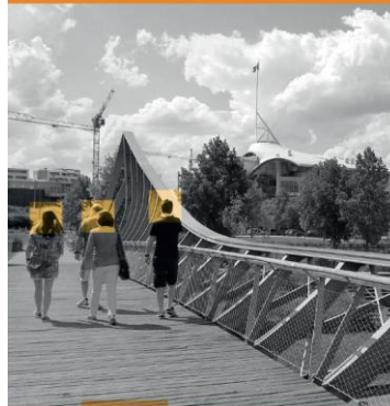
5 clés de lecture, 3 échelles de projet, 4 familles d'ouvrages d'art

Partager les clés de lecture de la qualité de vie d'un OA, à différentes échelles du territoire,