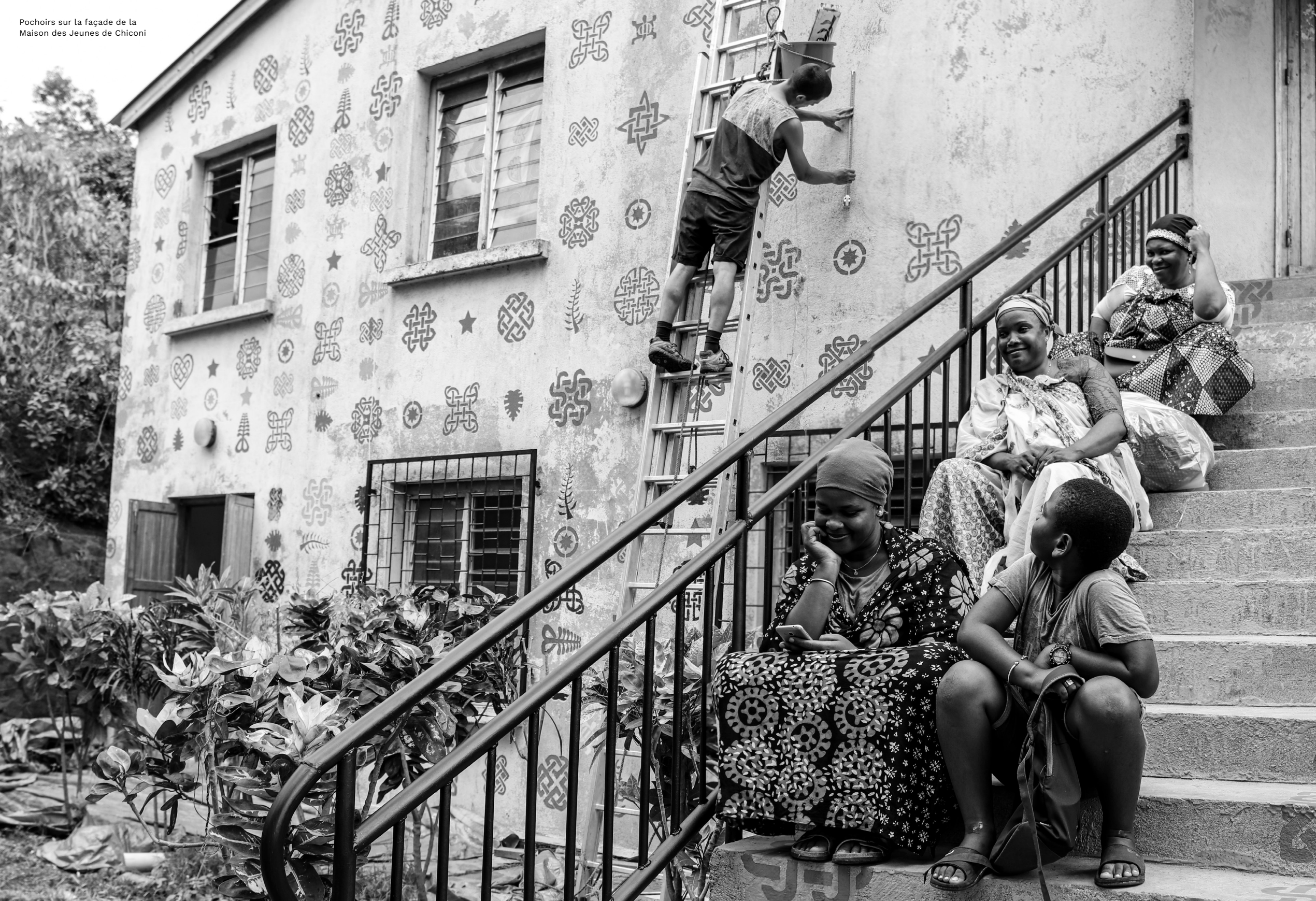
Pochoirs sur la façade de la Maison des Jeunes de Chiconi