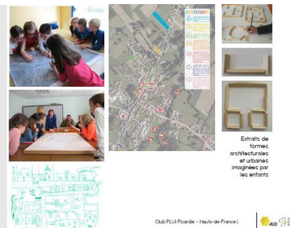
Extraits de formes architecturales et urbaines imaginées par les enfants

Pour la réalisation de leur PLUi, certaines communautés de communes font appel à la créativité des enfants : c'est le cas pour la communauté de communes du Canton de Fauquembergues , qui, dans le cadre d'une approche AEU (Approche Environnementale de l'Urbanisme, ADEME), a fait réfléchir les élèves d'une école sur les orientations d'aménagement.