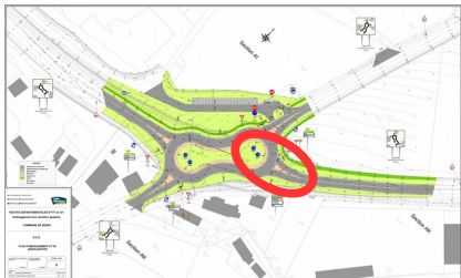
Deux accidents matériels.