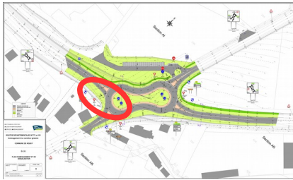
Installation temporaire de plaque métallique.