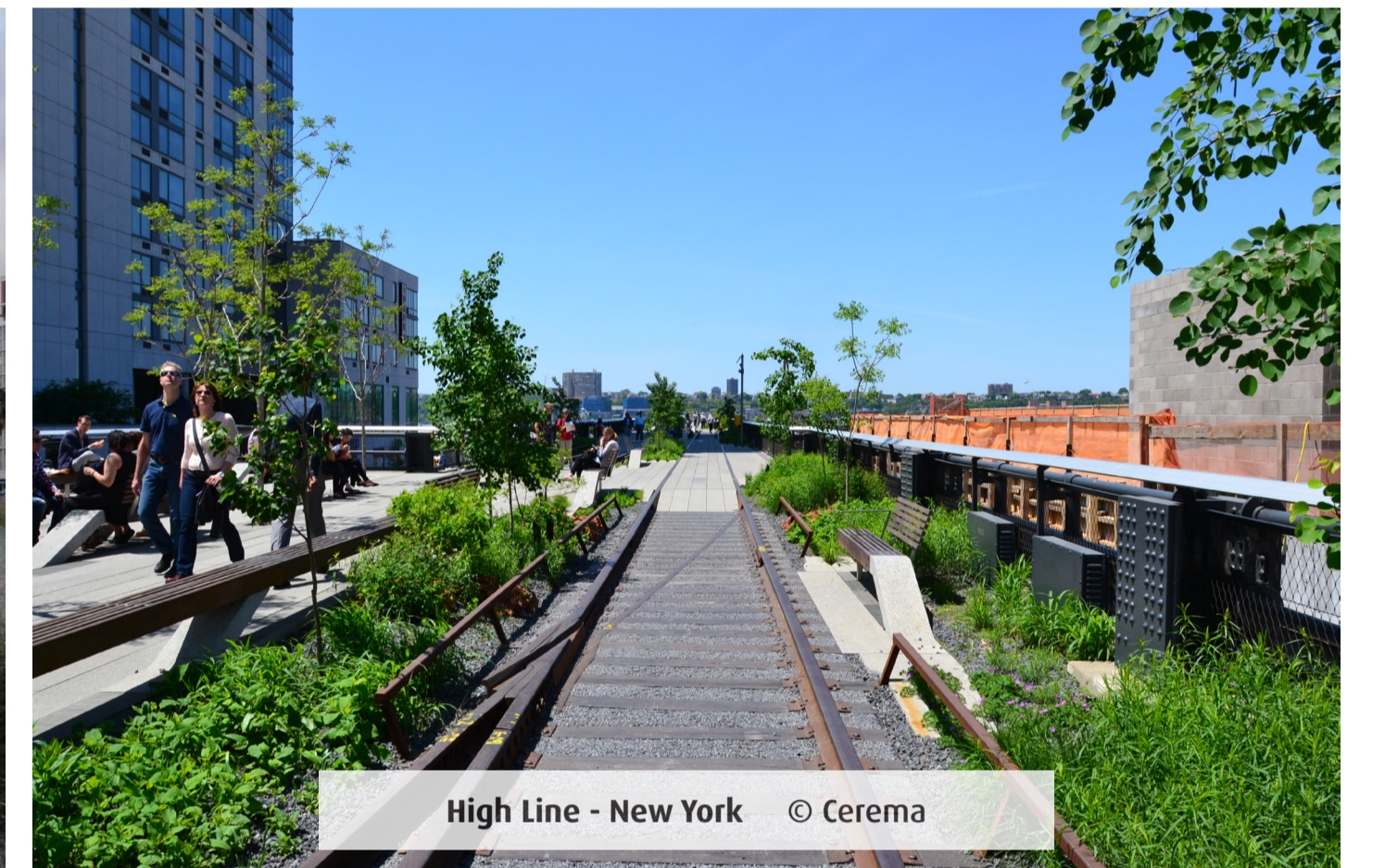
High Line - New York