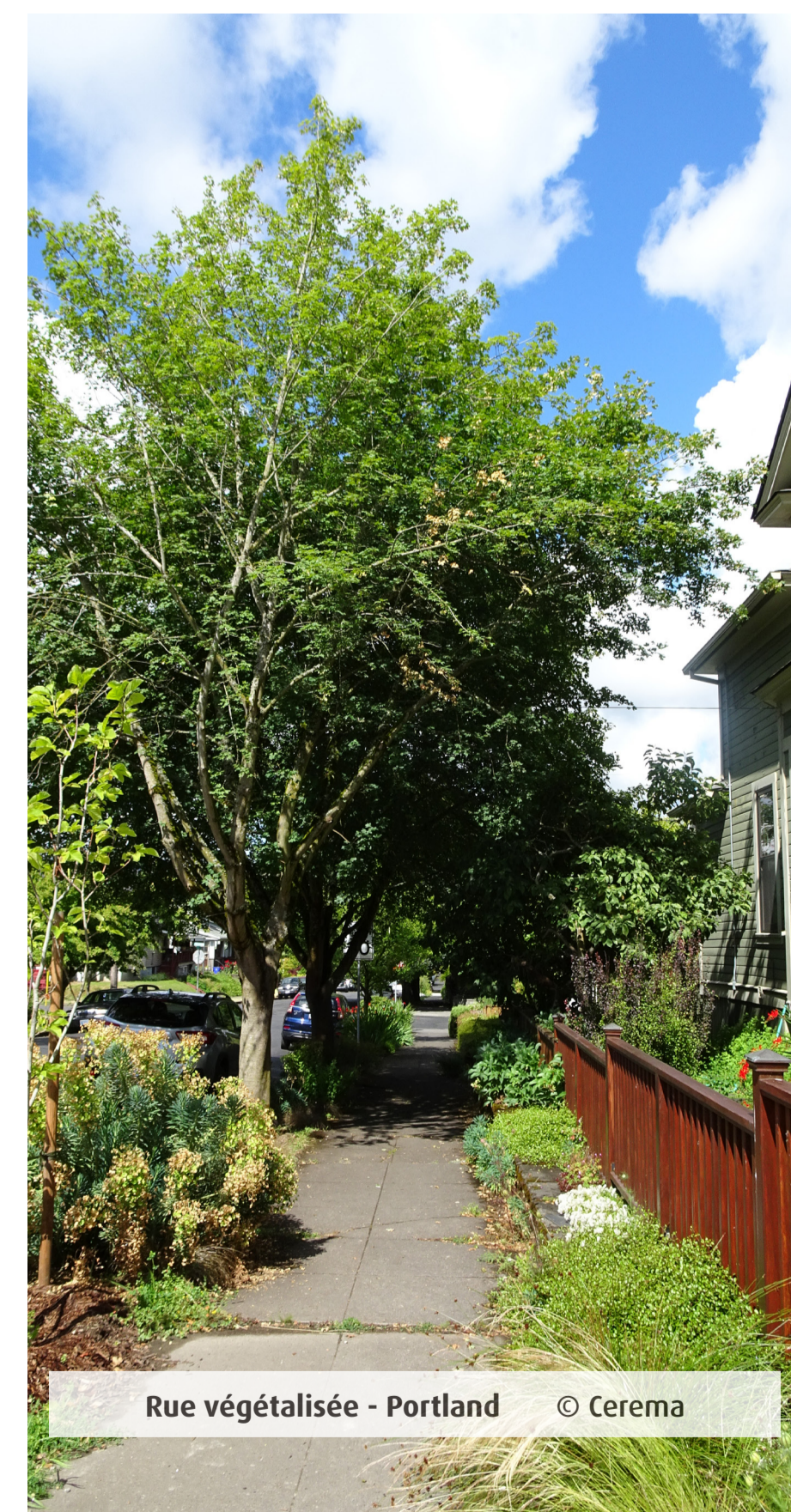
Rue végétalisée - Portland