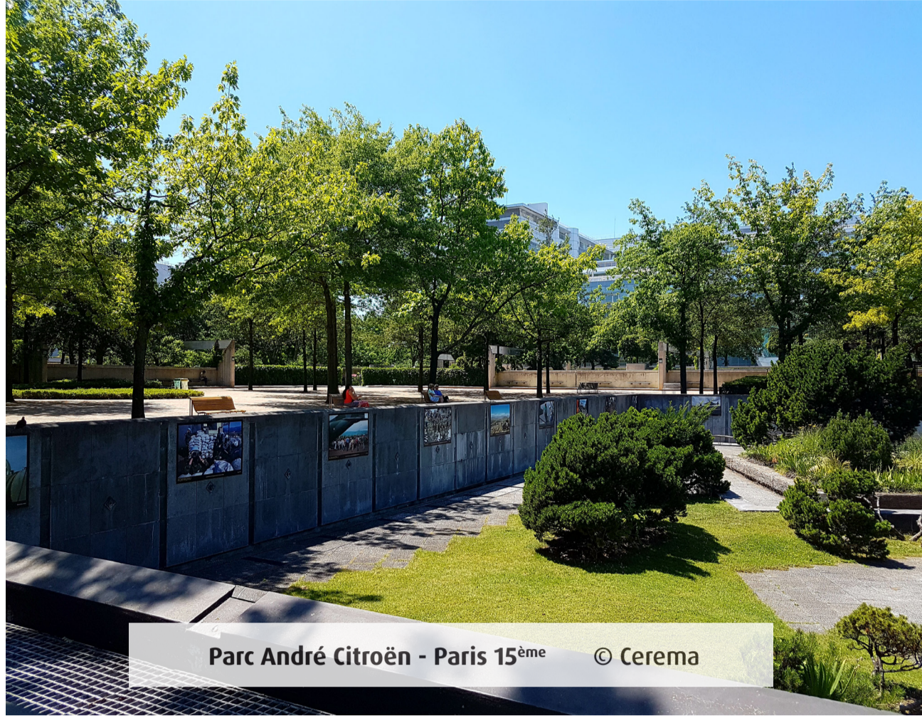
Parc André Citroën - Paris 15 ème