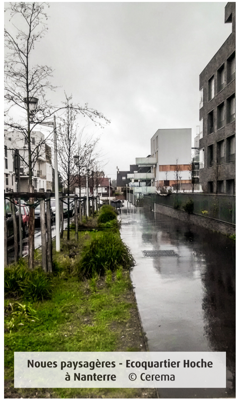
Nouvelles paysagères - Ecoquartier Hoche à Nanterre