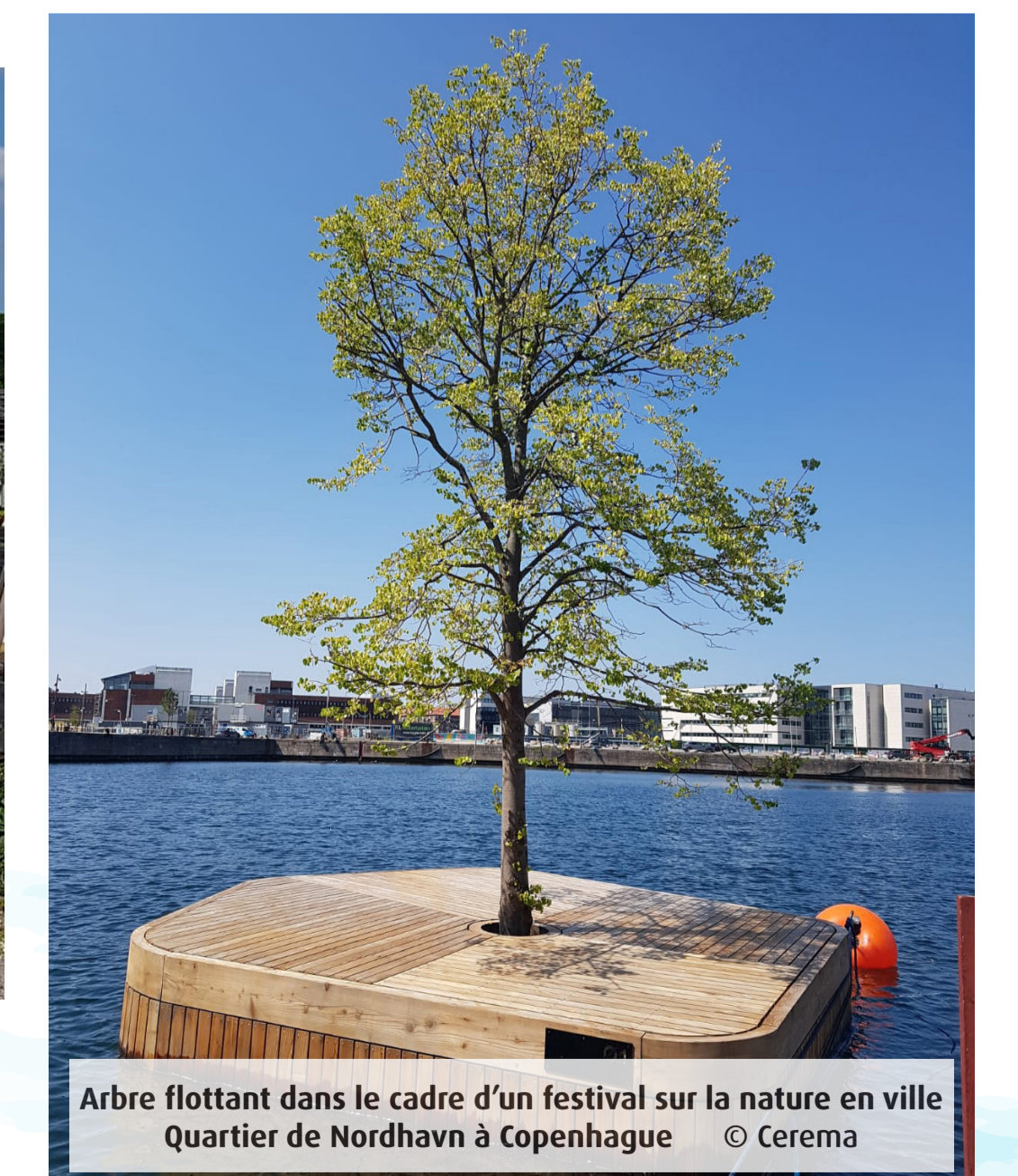
Arbre flottant dans le cadre d'un festival sur la nature en ville - Quartier de Nordhavn à Copenhague