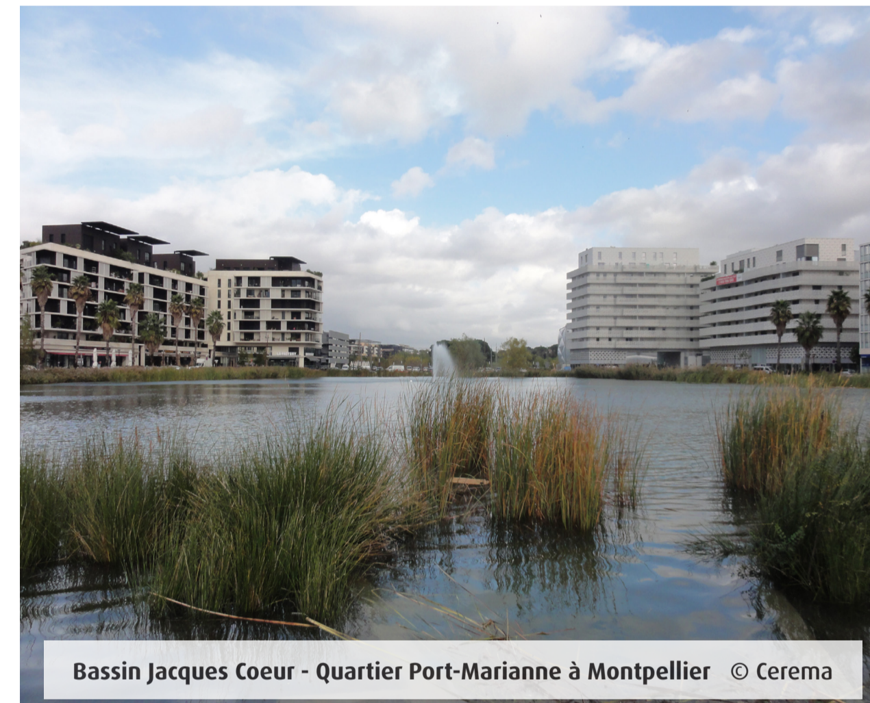
Bassin Jacques Coeur - Quartier Port-Marianne à Montpellier