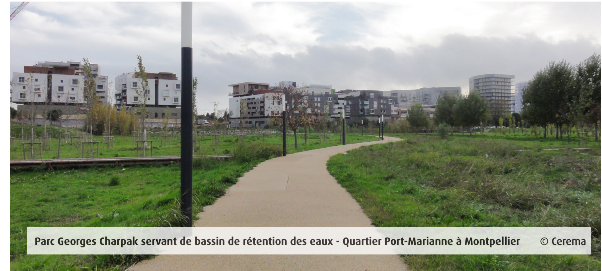
Parc Georges Charpak servant de bassin de rétention des eaux - Quartier Port-Marianne à Montpellier