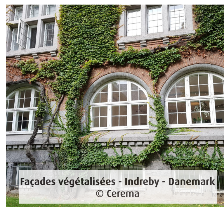
Façades végétalisées - Indreby - Danemark