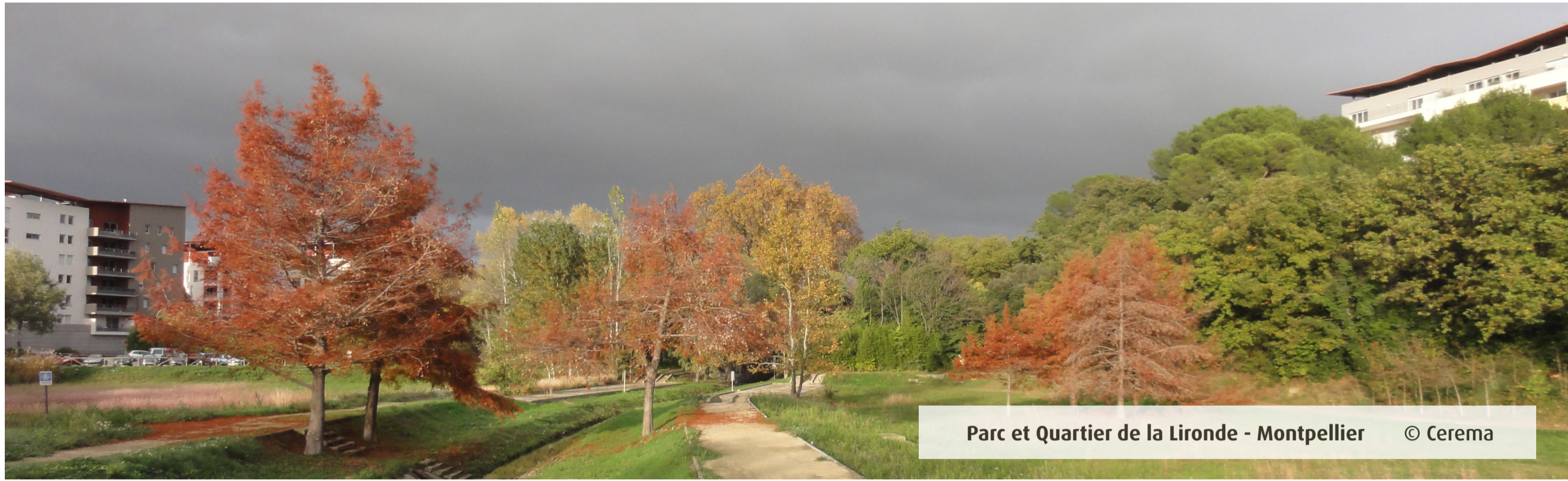
Parc et Quartier de la Lironde - Montpellier