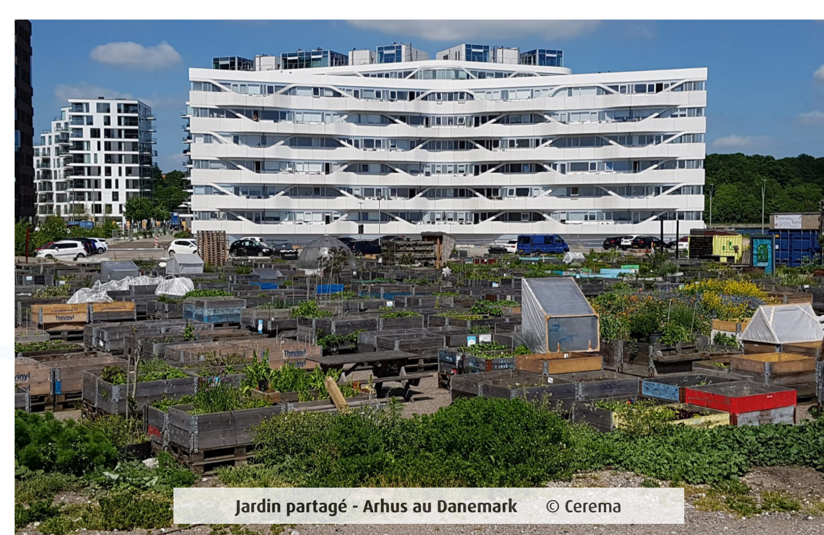
Jardin partagé - Arhus au Danemark