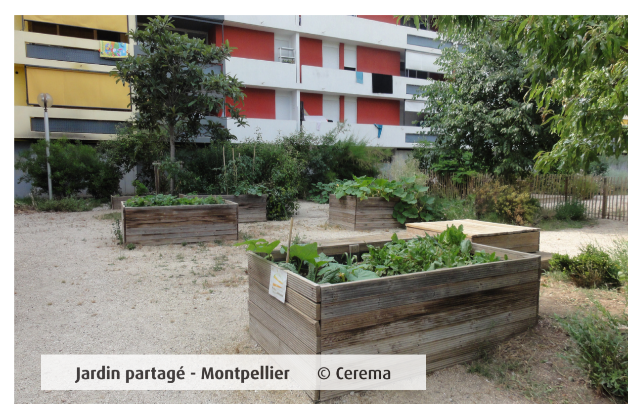
Jardin partagé - Montpellier