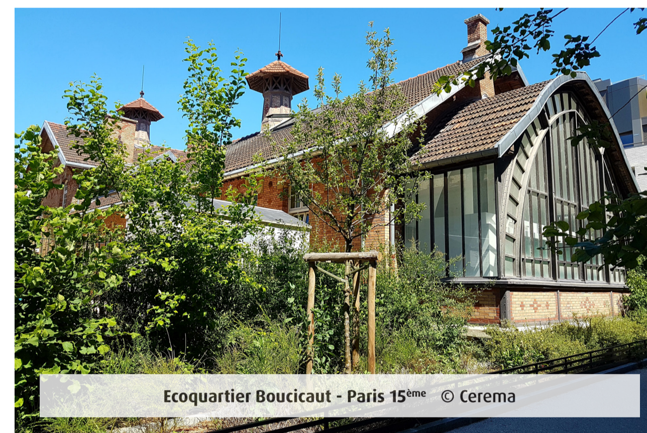
Ecoquartier Boucicaut - Paris 15 ème