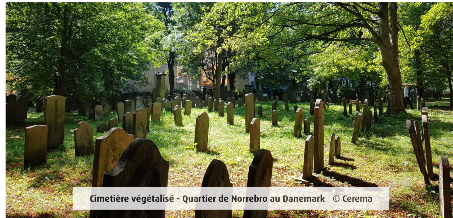
Cimetière végétalisé - Quartier de Norrebro au Danemark