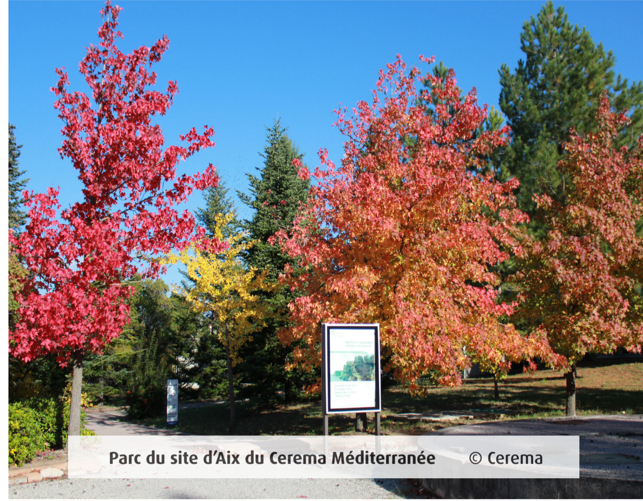
Parc du site d'Aix du Cerema Méditerranée