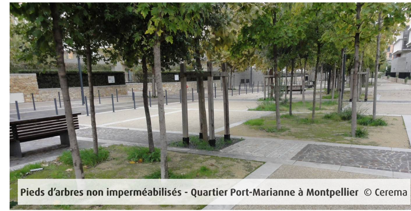
Pieds d'arbres non imperméabilisés - Quartier Port-Marianne à Montpellier