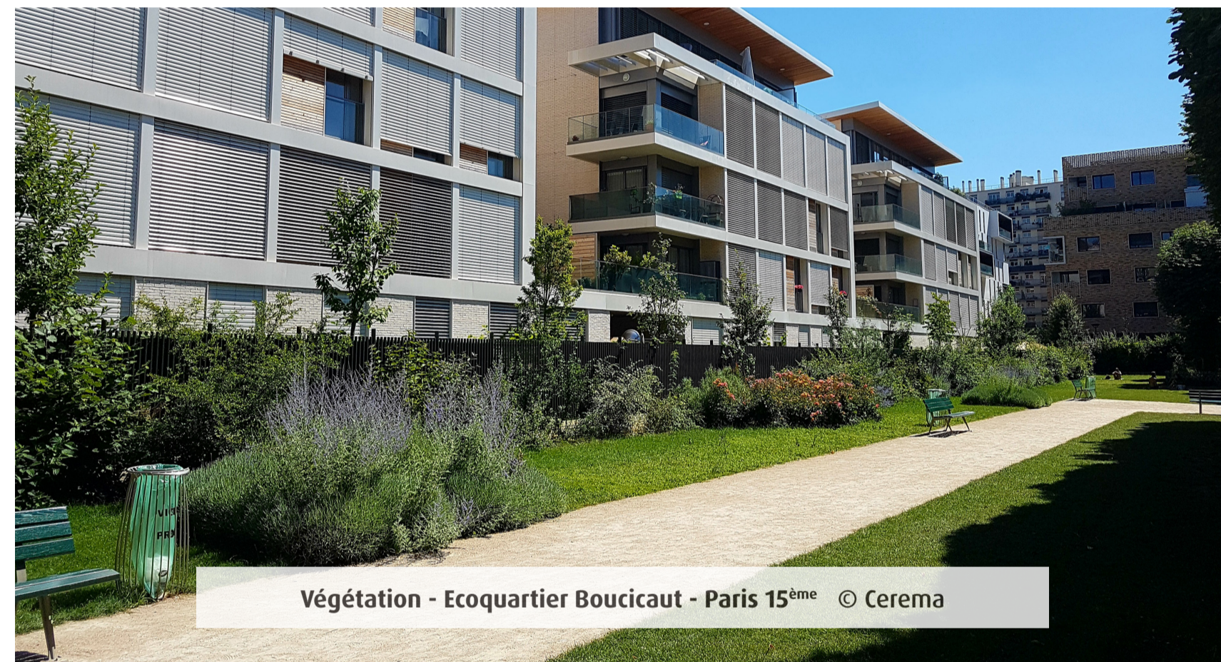
Végétation - Ecoquartier Boucicaut - Paris 15 ème