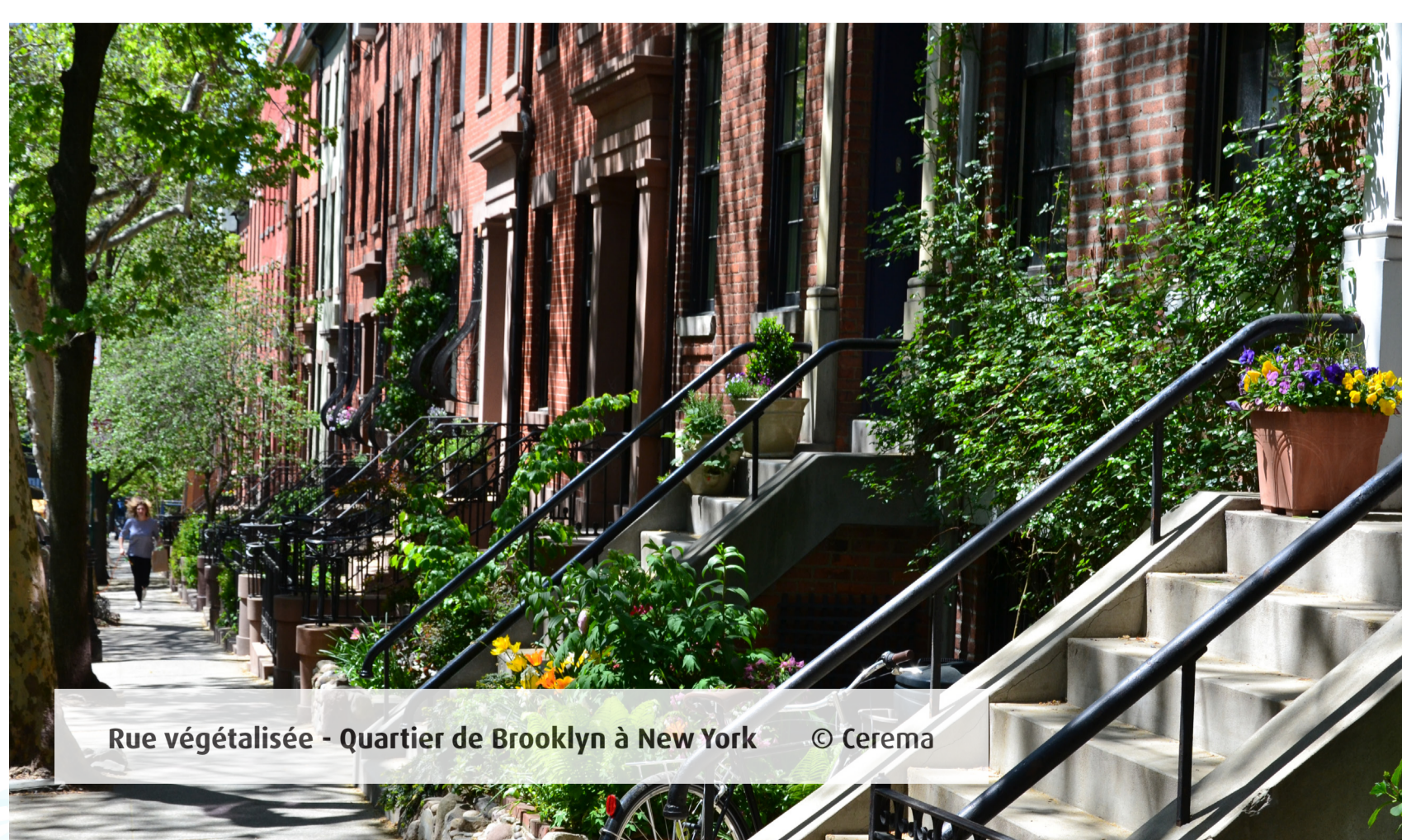
Rue végétalisée - Quartier de Brooklyn à New York