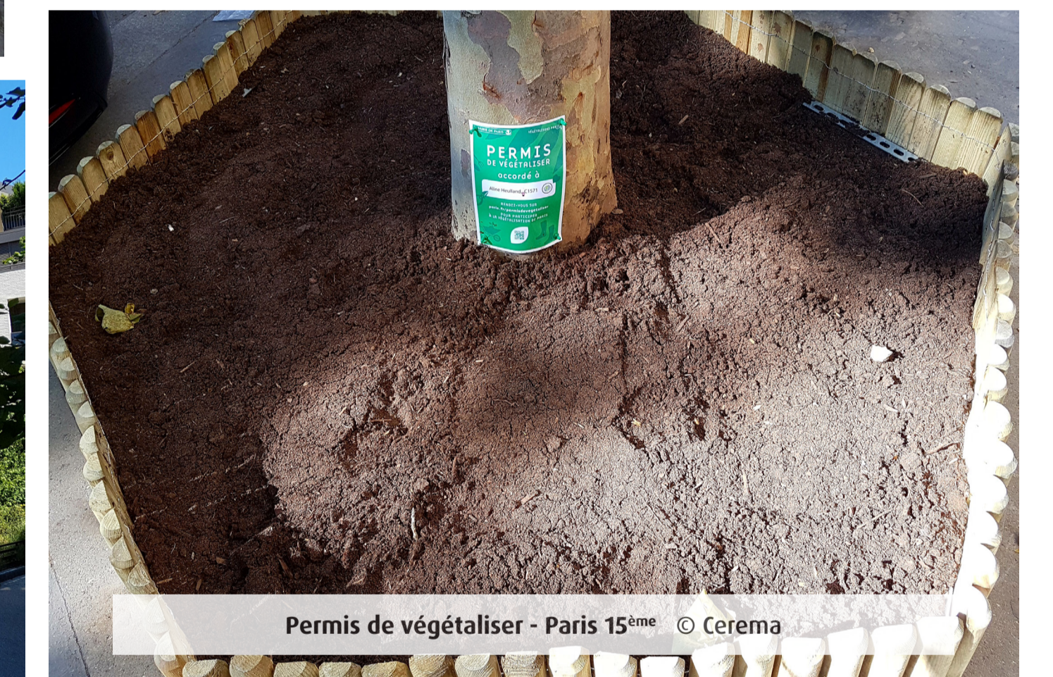
Permis de végétaliser - Paris 15 ème