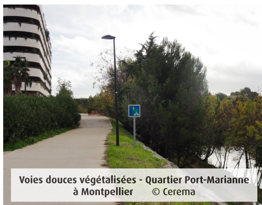
Voies douces végétalisées - Quartier Port-Marianne à Montpellier