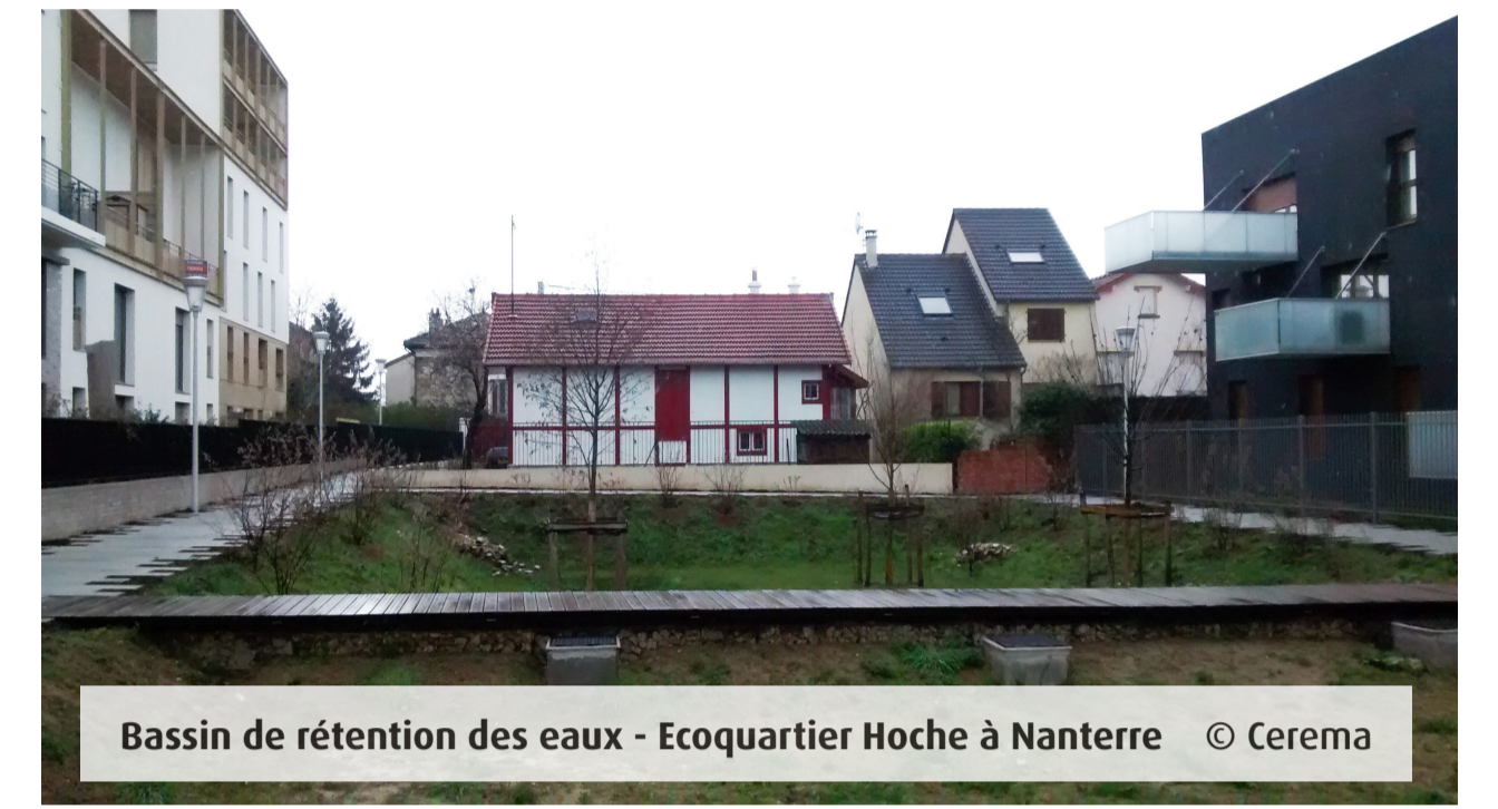
Bassin de rétention des eaux - Ecoquartier Hoche à Nanterre