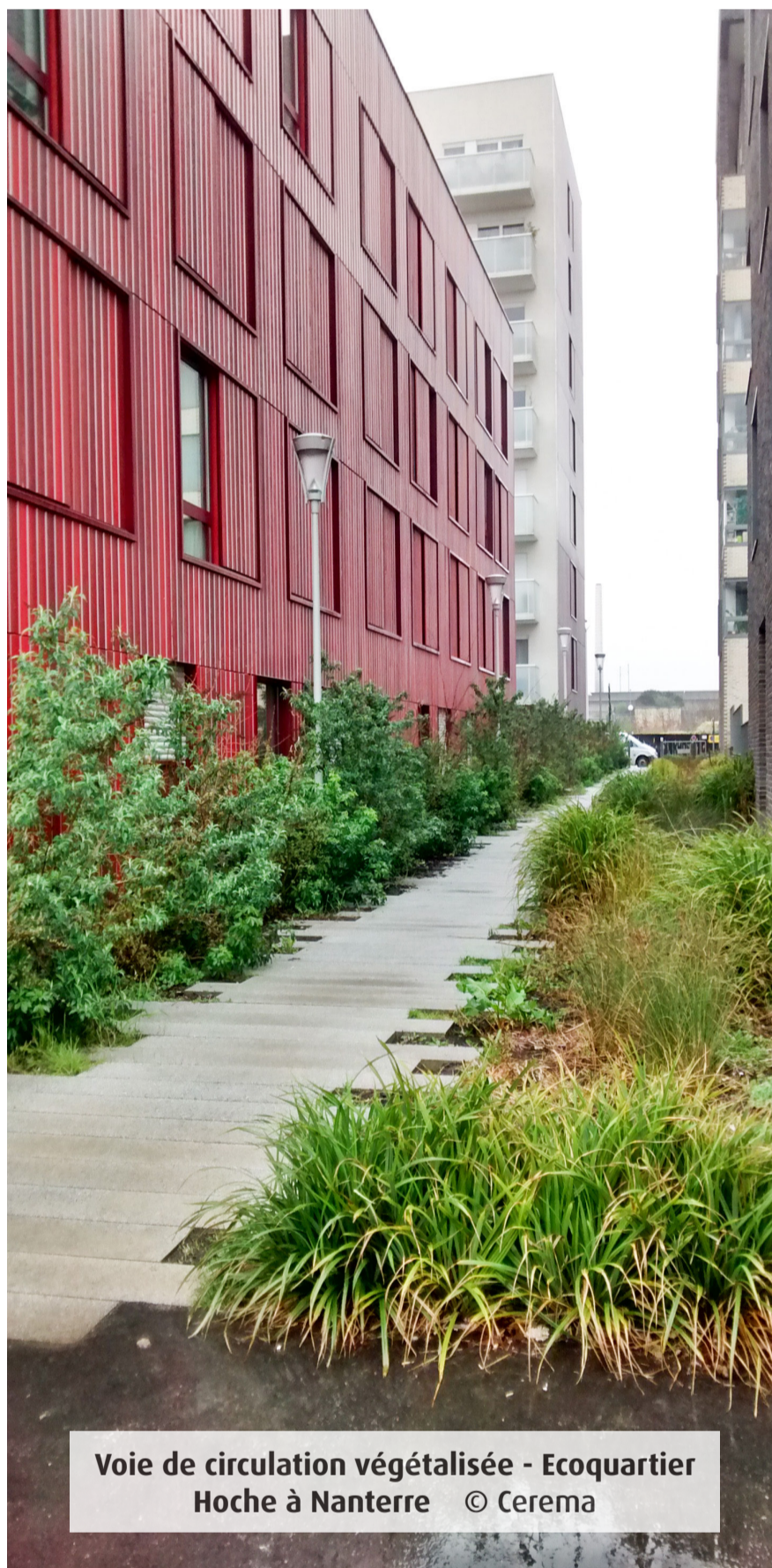
Voie de circulation végétalisée - Ecoquartier Hoche à Nanterre