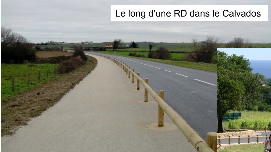
Le long d'une RD dans le Calvados