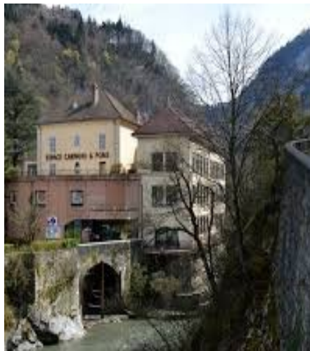
Musée de l'horlogerie et du décolletage à Cluses