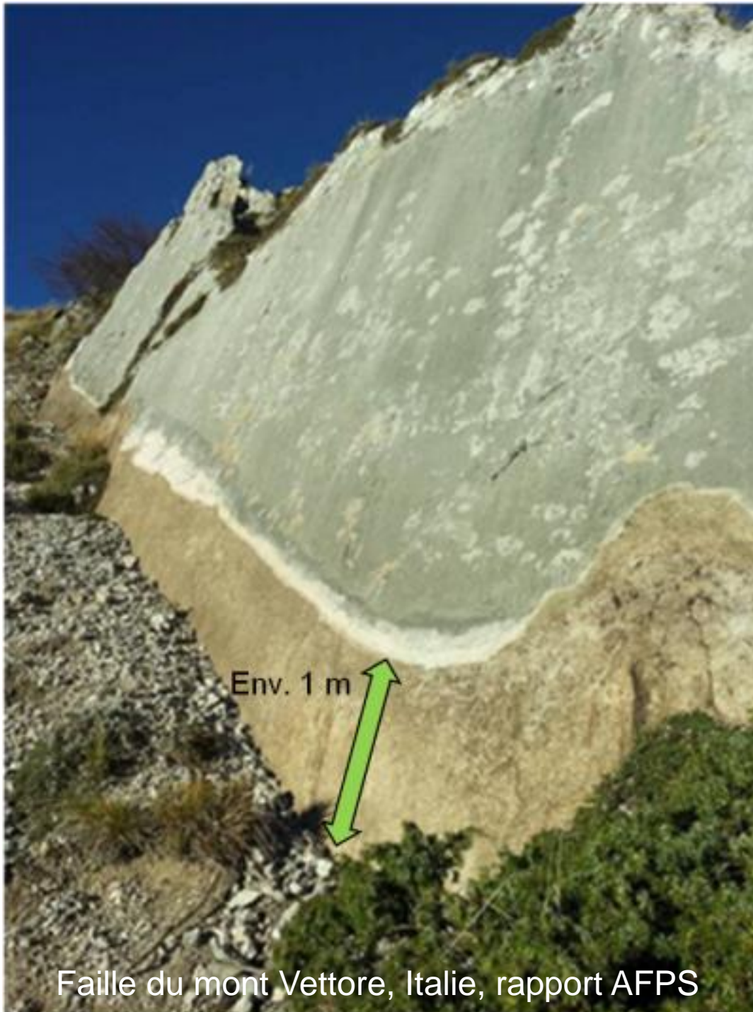
Faille du mont Vettore, Italie, rapport AFPS