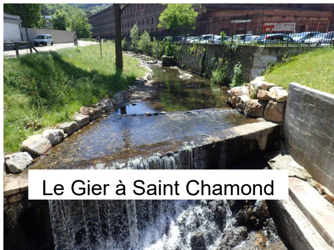
Le Gier à Saint Chamond