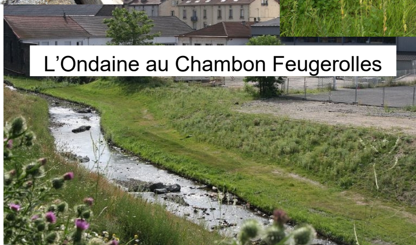
L'Ondaine au Chambon Feugerolles

Retour d'expérience sur le territoire de Saint Etienne Métropole