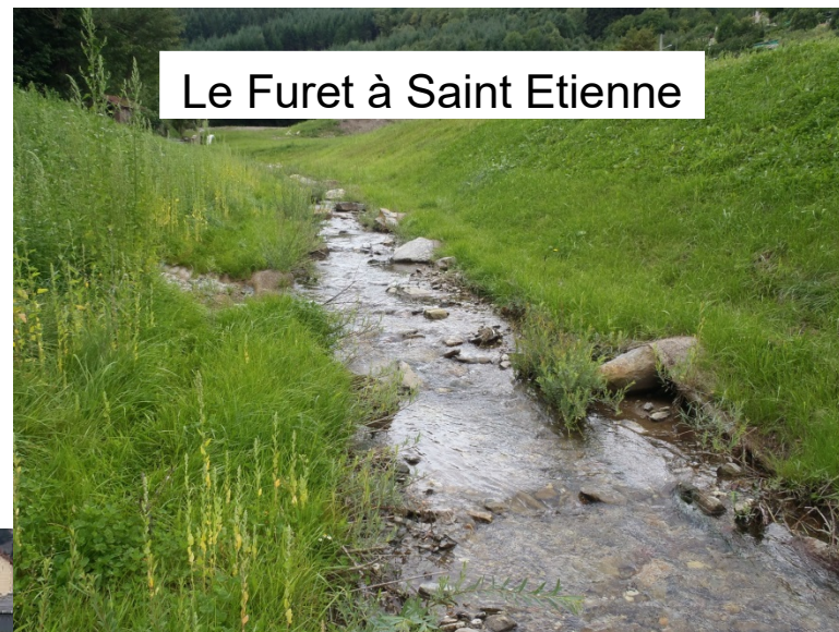
Le Furet à Saint Etienne