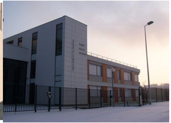
Collège des Hautes Rayes