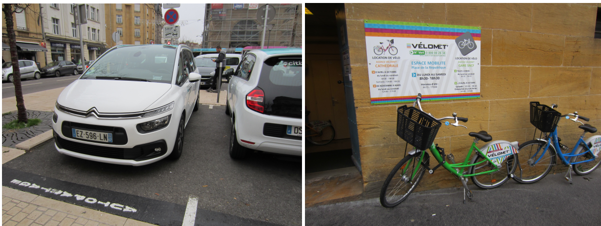
autopartage et location de vélo à Metz

L'atelier qui s'est réuni à Metz les 15 et 16 novembre 2018 a tenté de répondre à ces questions émergentes, en faisant le point sur les initiatives existantes.