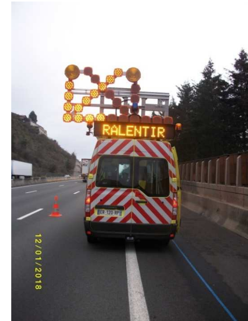
VD largeur 3m40 avec BAU Intervention FLU décalée Fourgon axé sur BDD