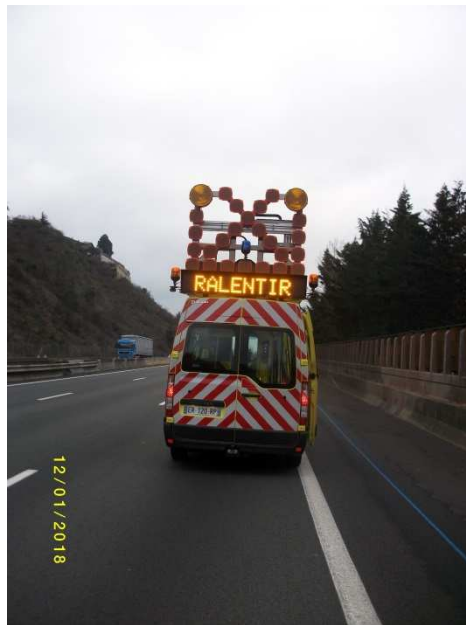
VD largeur 3m40 avec BAU Intervention FLU classique