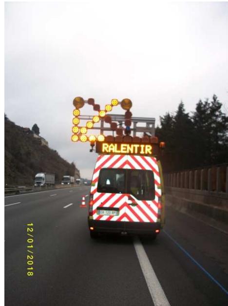
VD largeur 3m40 avec BAU Intervention FLU décalée Fourgon décalé de 40cm