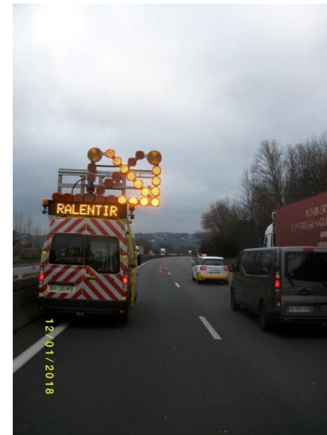
VG largeur 3m15 avec BDG Intervention FLU décalée Fourgon contre TPC