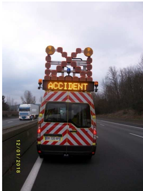
VG largeur 3m15 avec BDG Intervention FLU classique