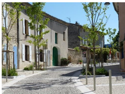
Figure 1 Le Poët-Laval