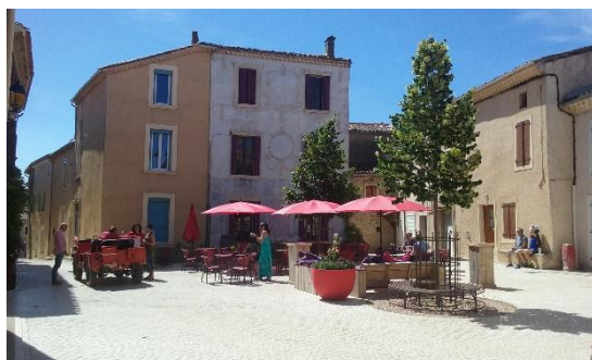
Figure 2 Place d'Assignan