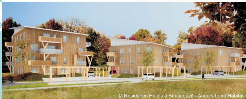
© Résidence Hélios à Beaucouzé - Angers Loire Habitat