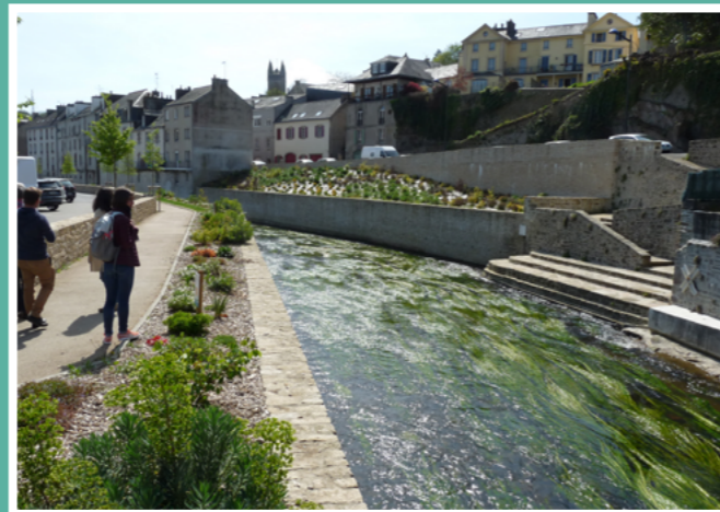
Réaménagement des berges de l'Isole à Quimperlé suite aux inondations de 2013 et 2014