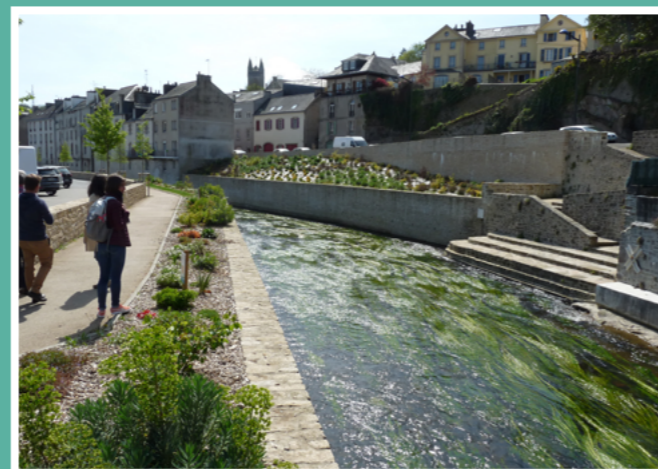
Réaménagement des berges de l'Isole à Quimperlé suite aux inondations de 2013 et 2014