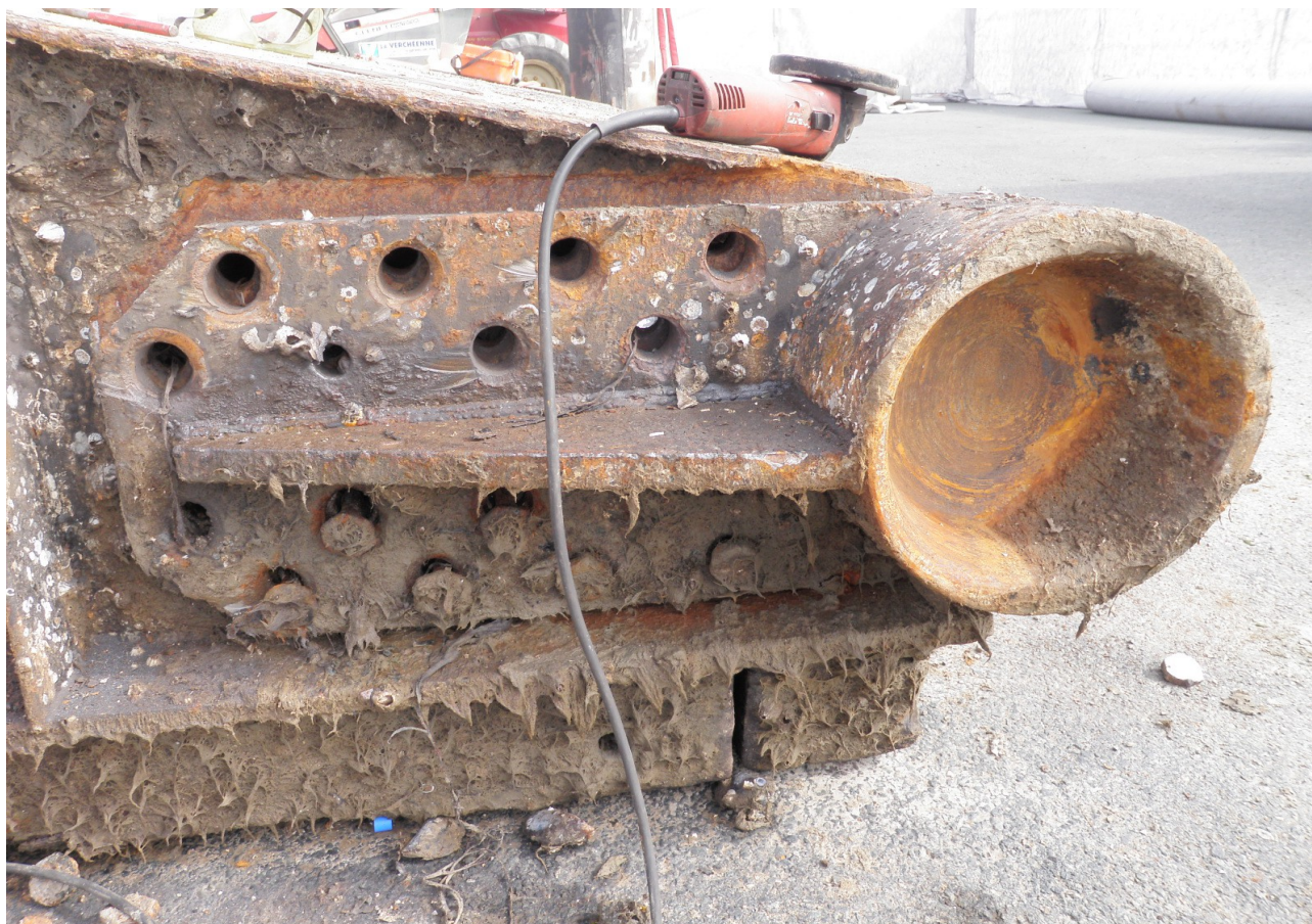
- Crapaudine et pivot -