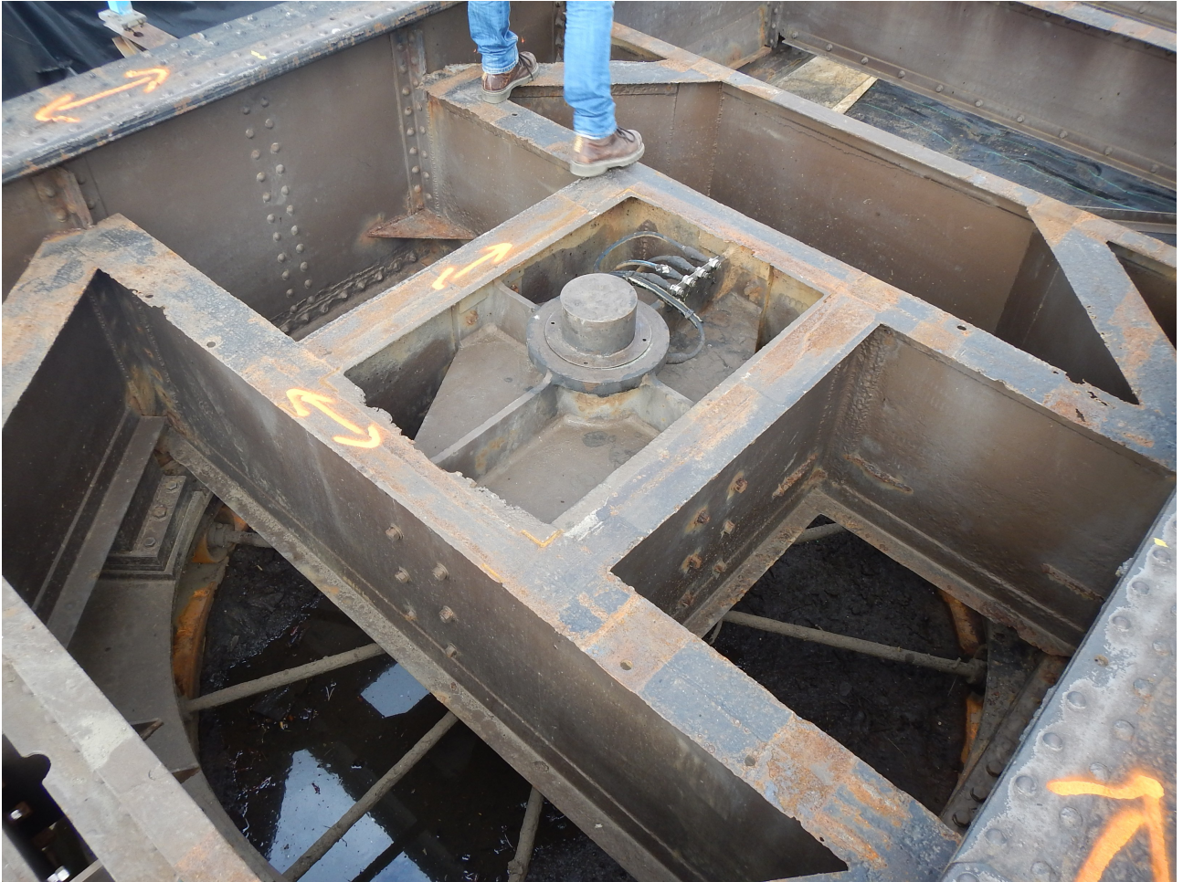
- dispositif de rotation de l'ouvrage -