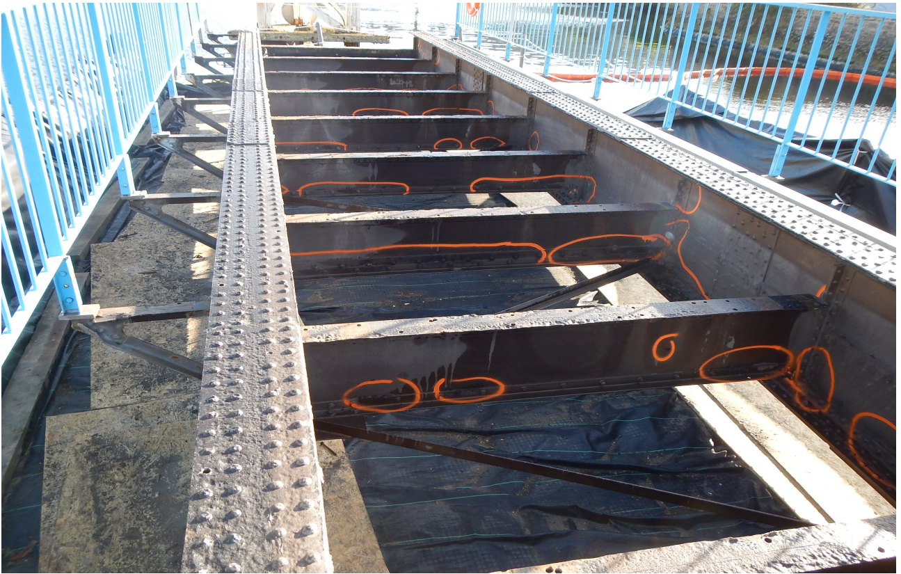
- corrosion du tablier métallique -