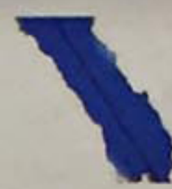
Carte type D