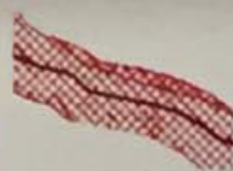
Carte type B