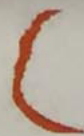
Carte type C