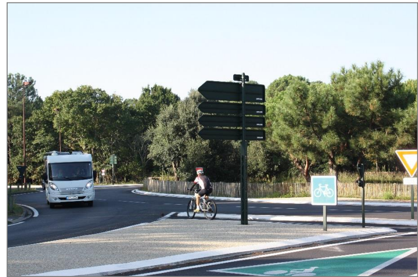
CD33 – Dune du Pilat