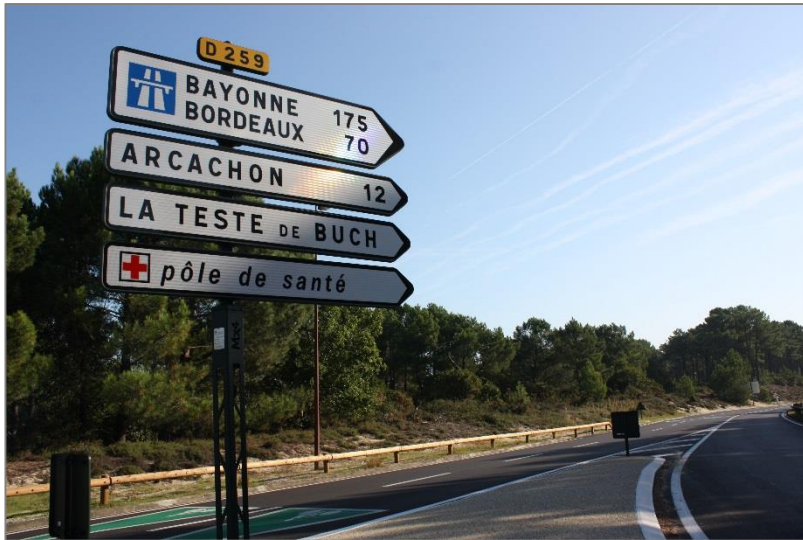
CD33 – Dune du Pilat