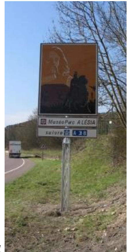
Dijon - CD21

Incident en interurbain sortie agglomération vitesse limite 70 km/h pas de victime