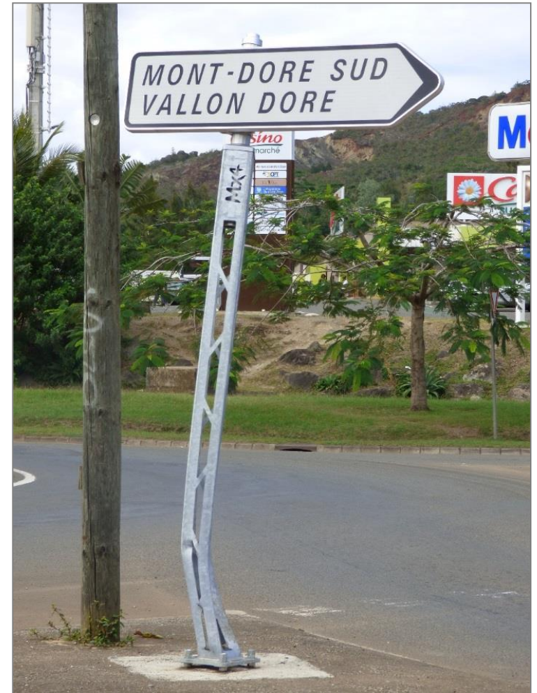
Nouvelle-Calédonie – Mont-Dore

Incident en milieu urbain entrée giratoire vitesse faible déformation sans rupture voiture retenue a évité un choc brutal avec support bois