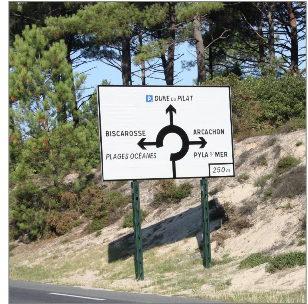
CD33 – Dune du Pilat