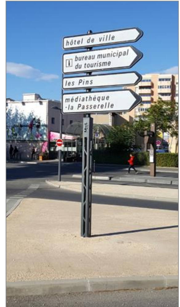
Ville de Vitrolles

éviter les dommages collatéraux retenir le véhicule (support HE)