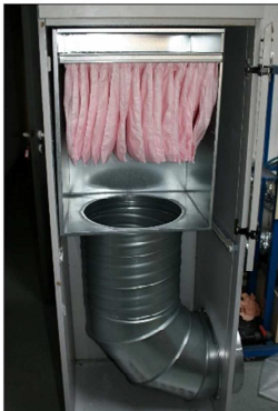
Caisson filtre F7