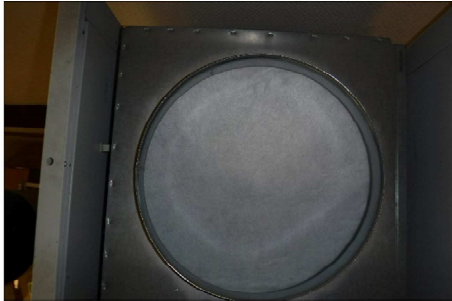
Caisson filtre G4