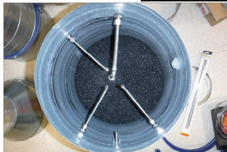
Filtre charbon actif