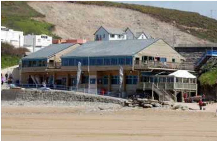
Extreme Academy, New Quay