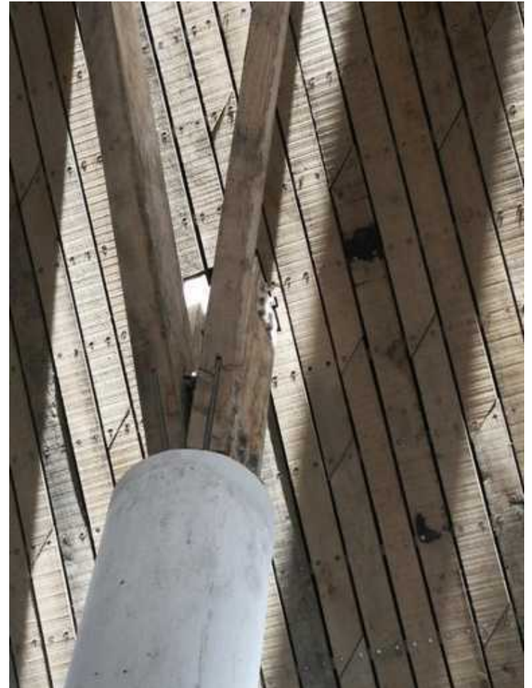
National Maritime Museum, Falmouth