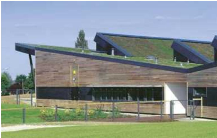
Great Notley Primary School