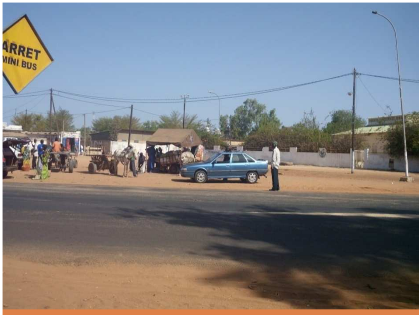
Ecole non encore aménagée