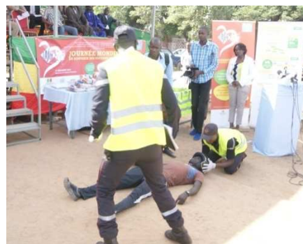
Démonstration publique avec les sapeurs pompiers