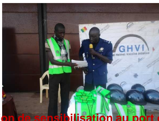
Session de sensibilisation au port du casque et don association de jeunes cyclistes et rollers