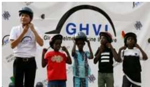
Helmets for kids Campaign remise casques