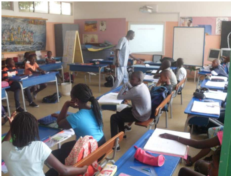
Formation théorique Ecole Franco Sénégalaise Fann Dakar