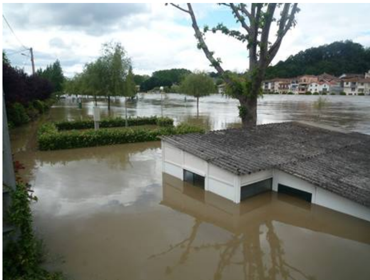
Crue de juin 2013 à Peyrehorade Gasset (40)

Complétez vos connaissances sur le sujet avec :